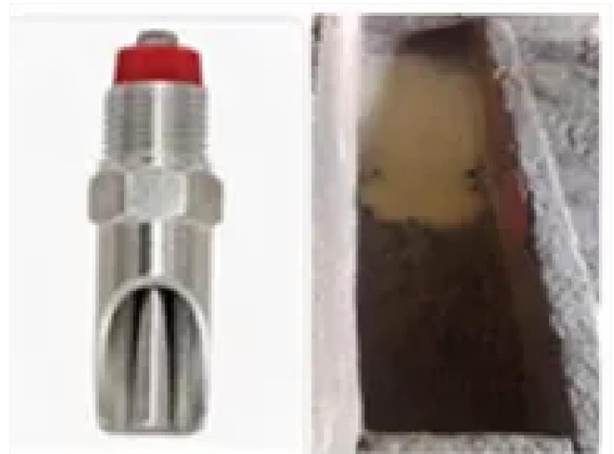
Figura 5 bebederos y comederos