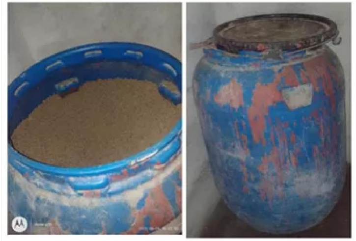
ALIX YATE 27 DE SEPTIEMBRE DE 2023 17:38 UTC