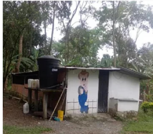
ALIX YATE 27 DE SEPTIEMBRE DE 2023 17:38 UTC