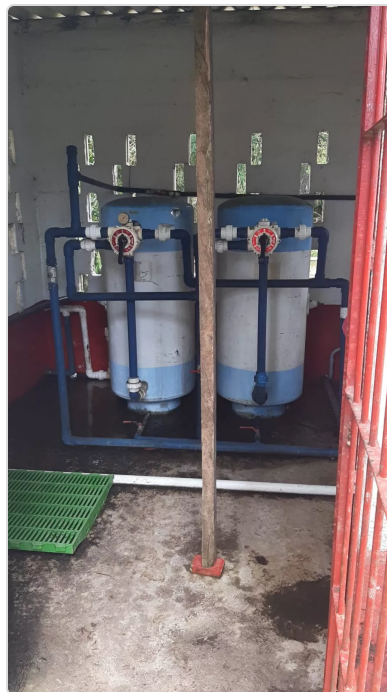
Figura 10. Planta tratamiento de agua