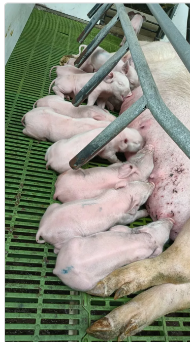
Figura 3. Sala de maternidad

En la finca hay planes de vacunación, planes sanitarios y protocolos para el manejo adecuado de cada uno de lo biológicos que requieren los animales en cada una de las etapas de producción. Cada uno de los animales cuentan con chapeta de identificación oficial y el Registro Único de Identificación RUI. Toda granja de cerdos, bien sea destinada a la reproducción o a la ceba, debe conservar la guía sanitaria de movilización con la que ingresaron los animales al predio.