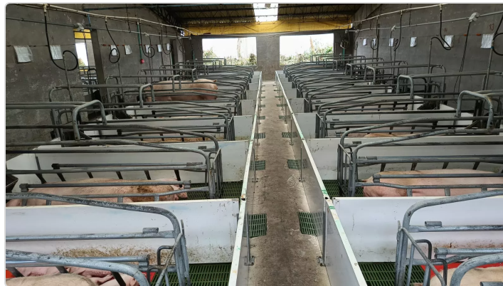
Figura 11. Sala de maternidad y cría