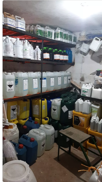
Figura 8. Bodega de insumos agropecuarios