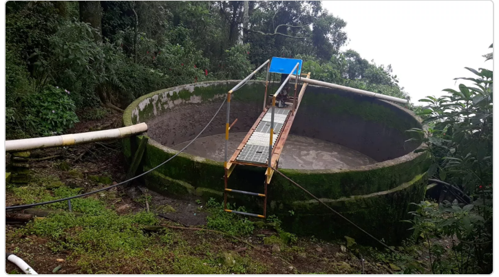
Figura 6. Tanque estercolero