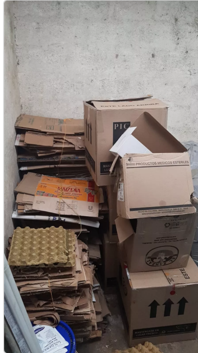
Figura 7. Manejo de residuos aprovechables