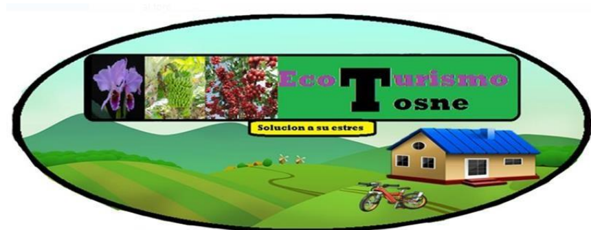
Logo Ecoturismo Tosne