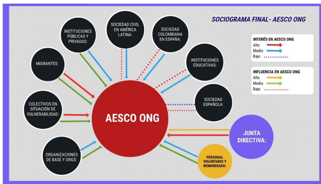
Figura 2 Sociograma Final