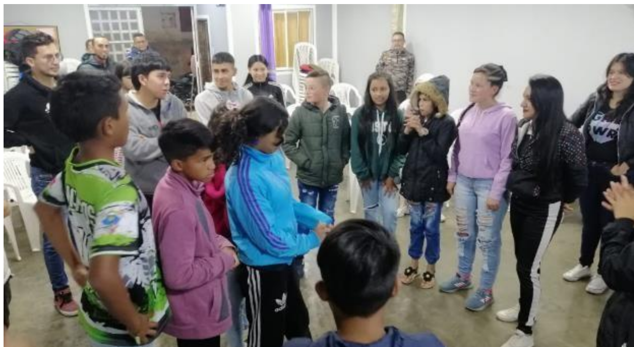
Septiembre 2023.