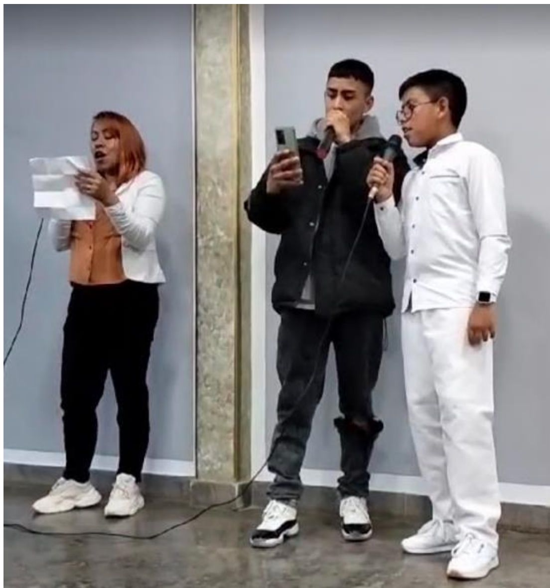
Septiembre 2023.