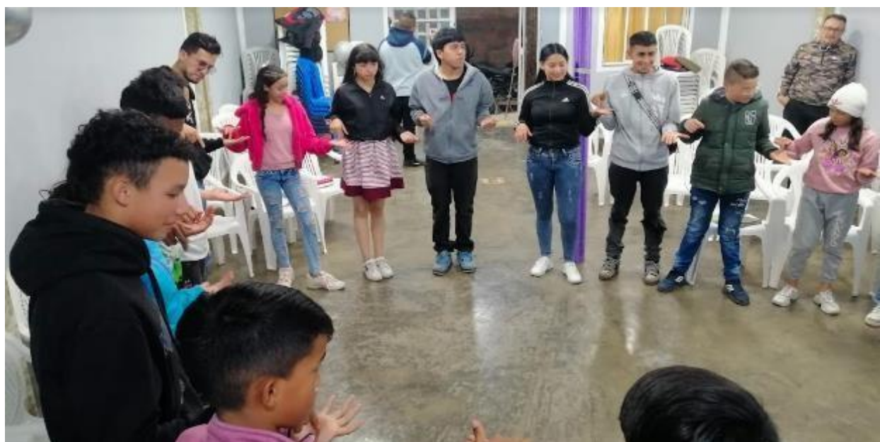
Foto tomada por Maria Eugenia Diaz (pastora de ELIM). Septiembre 2023.