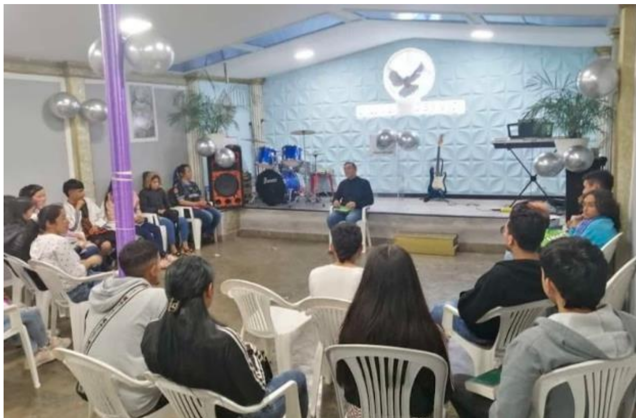
Septiembre 2023.