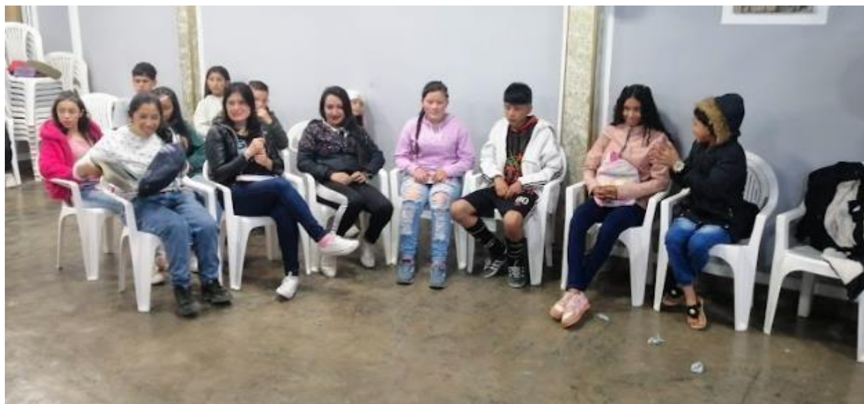
Septiembre 2023.