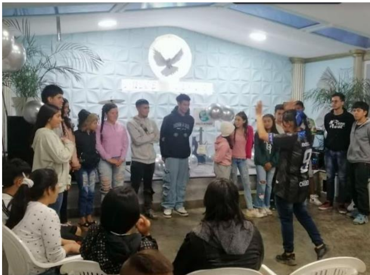
Septiembre 2023.