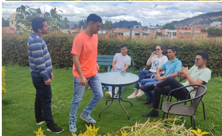
Reunion, 28 de septiembre de 2023