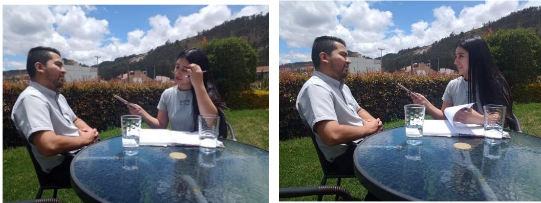
Evidencias de la entrevista 23 de septiembre 2023