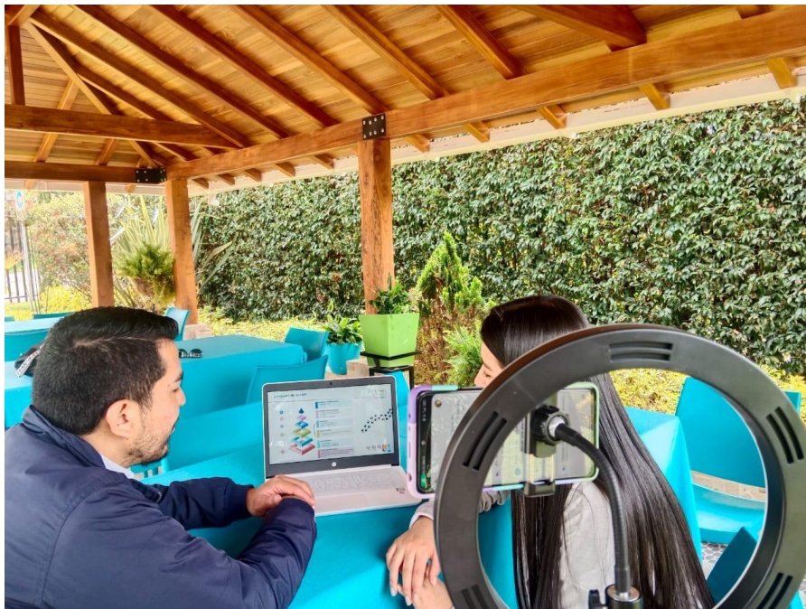
Encuentro 17 de noviembre