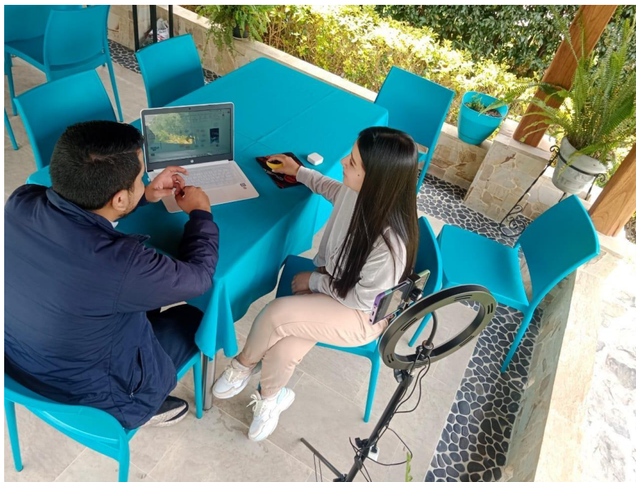
Encuentro 17 de noviembre