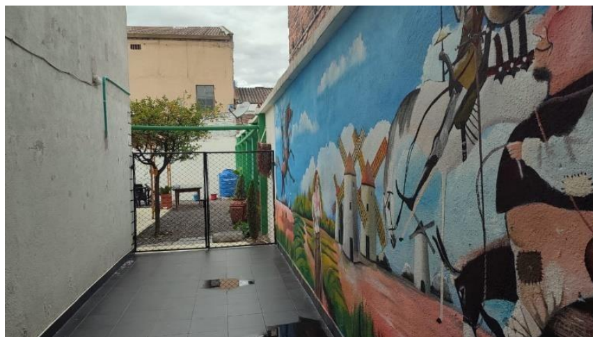
Entrada principal Fundación Trato Justo