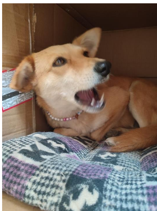
Kiara, se encuentra en postoperatorio