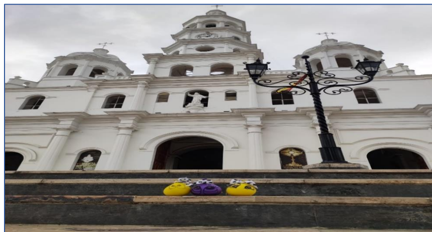
Foto Catedral Inmaculada Concepción Málaga, Santander