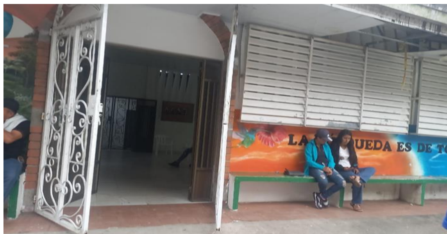
Foto Unidad De Atención Para Las Víctimas Bucaramanga, Santander