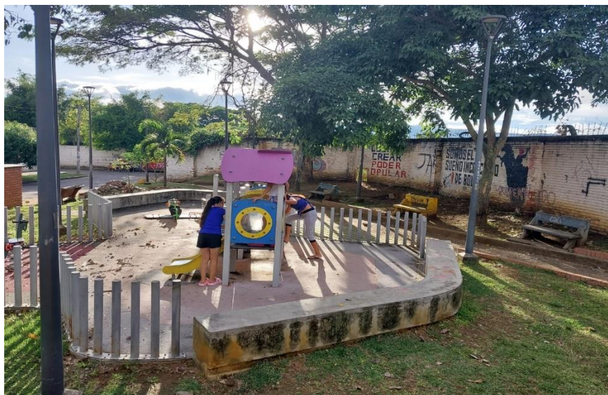
Foto Parque Barrio Gaitán, Bucaramanga, Santander