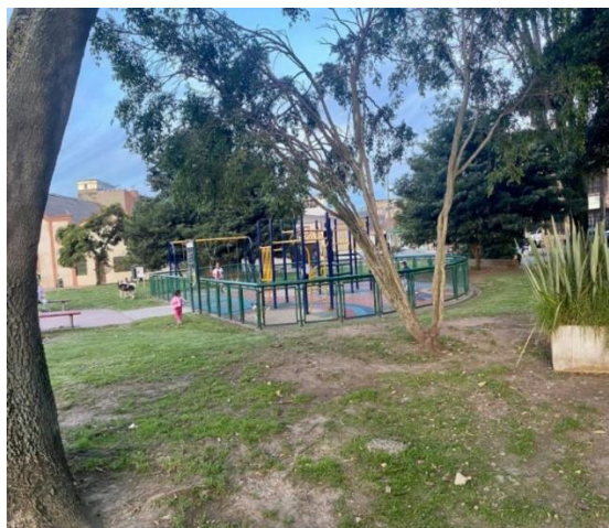
Foto parque recreacional de niños barrio Versalles, parque Santo Cristo, localidad Fontibón.