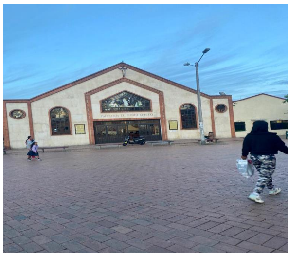
Foto de la iglesia del Barrio Versalles, parque Santo Cristo, localidad Fontibón.