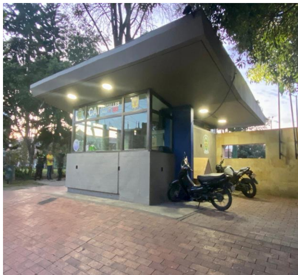
Foto Cai del barrio Versalles, parque Santo Cristo, localidad Fontibón