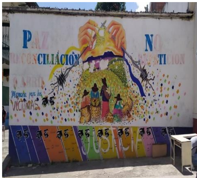
Foto Mural Tejiendo un Futuro de Esperanza Málaga