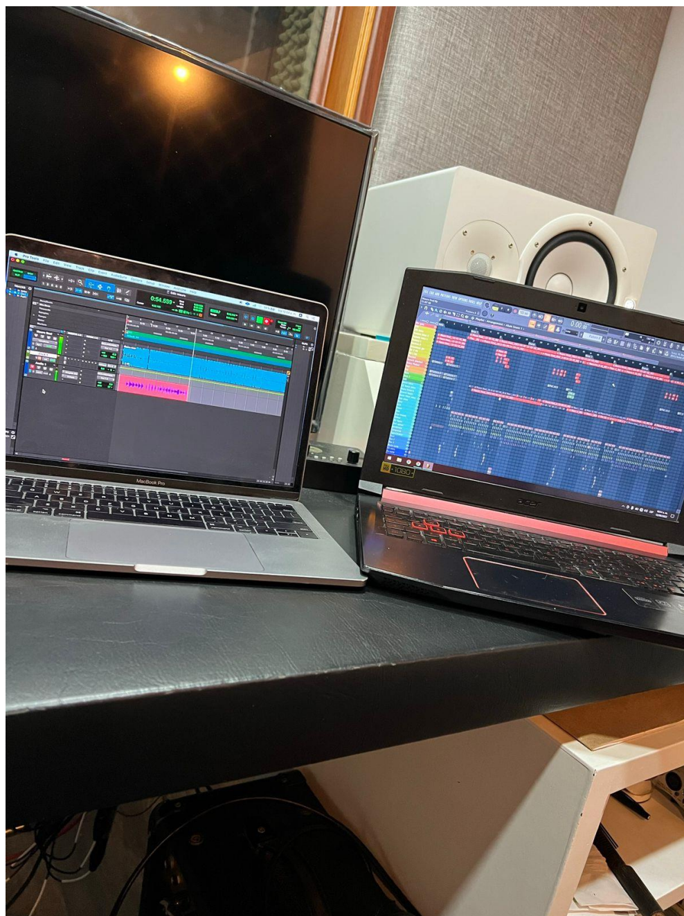
Imagen en el Control Room