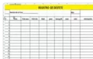
Figura 15. Hacienda El Reposo

Hacienda, fecha, nombre, empresa, placa-cédula, origen, motivo de visita, teléfono