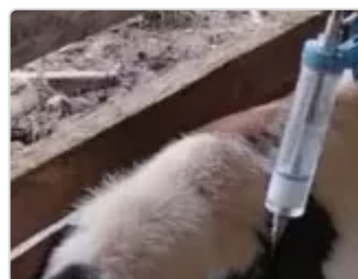
Figura 11. Hacienda El Reposo

En líneas generales, los animales con enfermedades leves que no interfieran con su movilidad continuarán en su grupo respectivo. Sin embargo, aquellos que presenten dificultades para desplazarse, necesiten