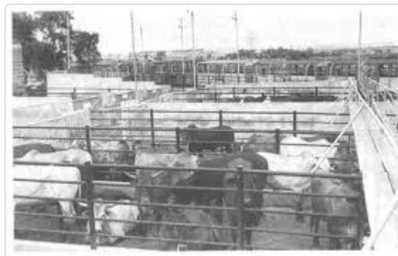
Figura 13. Protocolo cuarentena

En el momento de ingresar animales a la finca, estos deben ser llevados al potrero identificado para tal fin “Cuarentena”, en el cual debe haber pasto y agua a voluntad y con una ubicación distante de los potreros donde rota el resto de animales de la finca, con el fin de evitar posibles contagios de enfermedades, propendiendo por su fácil observación para su seguimiento. El periodo mínimo de permanencia en este corral de los animales recién ingresados a la finca, debe ser de 21 días.