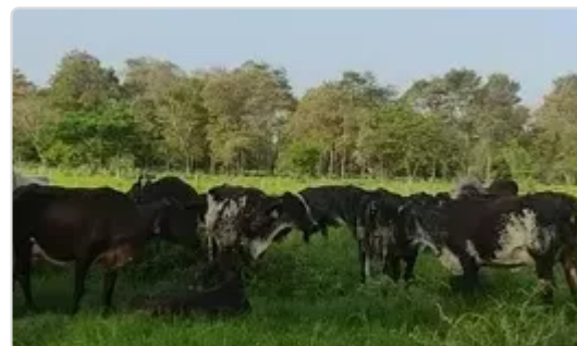
Figura 9. Hacienda El Reposo

⇒ La trazabilidad en un proyecto de BPG (Bovinos de Doble Propósito) en el municipio de El Paso, en el departamento de Cesar, es fundamental para garantizar la calidad y seguridad de los productos derivados de la actividad ganadera. Para asegurar la trazabilidad en este tipo de proyectos, se deben implementar medidas que permitan identificar y seguir el rastro de los animales a lo largo de toda la cadena de producción. Algunas de las acciones a tener en cuenta son: Identificación individual de cada animal, ya sea a través de aretes, microchips u otros sistemas de marcaje.