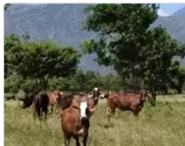
Figura 5. Hacienda El Reposo-Cotera, Sofanor