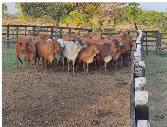
Figura 4. Hacienda El Reposo-Cotera, Sofanor

La finca es propiedad de este señor y administrada por el Sr. Wilfredo Castrillo. A la fecha se cuenta con 15 vacas en la finca con las siguientes edades: 10 vacas de 1 a 5 años y 5 vacas de 3 a 12 meses.