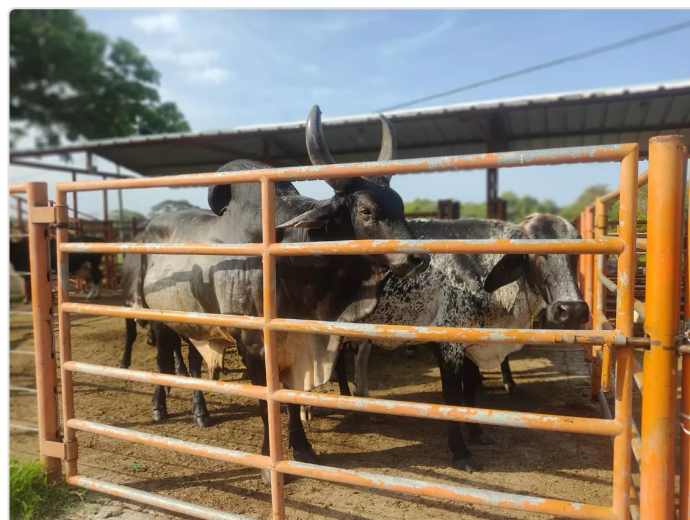
Figura 2. Reglamento Ica de la Hacienda El Reposo

⇒ La Resolución N° 02341, de 23 de agosto de 2007, regula las condiciones sanitarias y de seguridad para la producción primaria de ganado Doble propósito destinado al sacrificio para consumo humano. La Resolución N° 3585 de 20 de octubre de 2008, de conformidad con lo dispuesto en el Capítulo 1, Capítulo 2 del Decreto N° 616 de 2006, estableció un sistema oficial de inspección, evaluación y certificación de la producción primaria de leche. La Resolución N° 077044 del 5 de octubre de 2020 establece los requisitos de seguridad para la obtención del registro como granja Pecuaria para exportación. Resolución N° 097977 (27/05/2021) “Establece requisitos de certificación y promulga otras normas para los establecimientos exportadores de ganado vacuno y búfalo en pie y los establecimientos de faena para la exportación de carne”