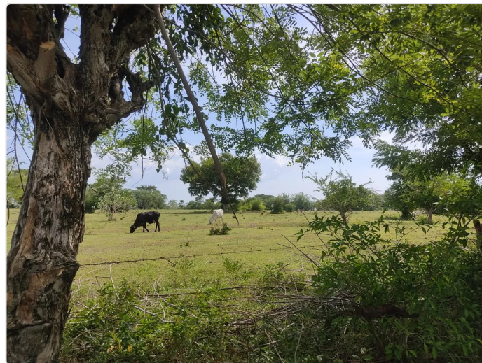
Figura 17. Hacienda El Reposo