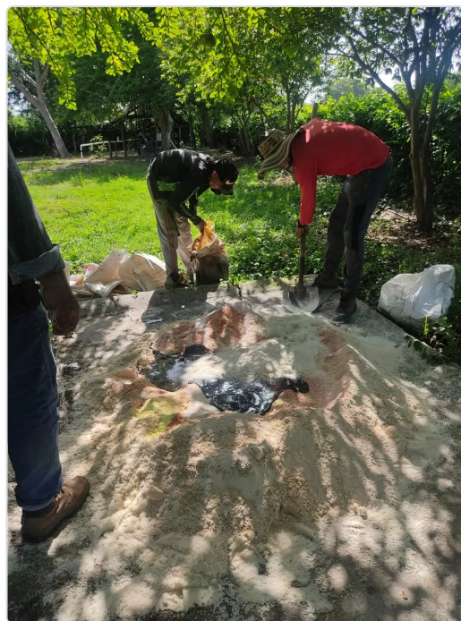
Figura 3. Hacienda El Reposo-Cotera, Sofanor