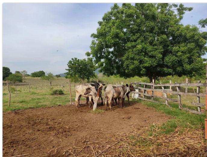
Figura 16. Hacienda El Reposo