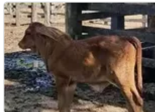
Figura 14. Hacienda el Reposo

Inflamación en diferentes partes del cuerpo, lengua, ojos.