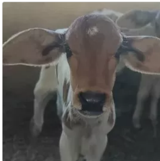
Figura 12. Hacienda El Reposo