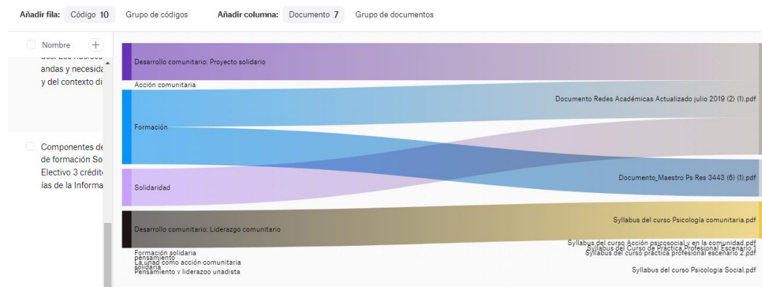
Diagrama de Sankey – Beta

Nota: En la figura se presenta el diagrama de Sankey-Beta, que confirma los pocos hallazgos encontrados. Elaboración propia.