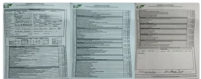
Figura 4. Lista de chequeo