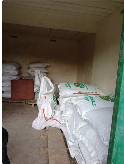
Figura 7. Imagen bodega de alimentos.

Está destinada solo para guardar sales, concentrados y la miel de purga, se les hace limpieza constantemente, están seleccionados según su propósito y ubicados en estivas, además se procura que los alimentos no estén guardados por mucho tiempo, generalmente se hacen pedidos semanales para no acumular alimento sin necesidad.