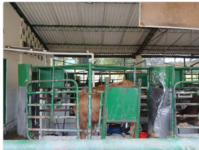
Figura 9. Imagen sala de ordeño.

El predio cuenta con un sistema de ordeño mecánico que va directamente al tanque de enfriamiento que está ubicado en una habitación aislada a la que solo entra el personal autorizado. La forma de la sala es tipo tándem, de cuatro puestos dos a cada lado, con suministro de concentrado por ración individual, los animales entran por un extremo y salen por el otro hacia un corral de descanso donde esperan mientras son llevadas al potrero, las instalaciones son lavadas dos veces al día después de los ordeños.