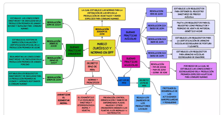
figura 1. Normatividad y Marco jurídico