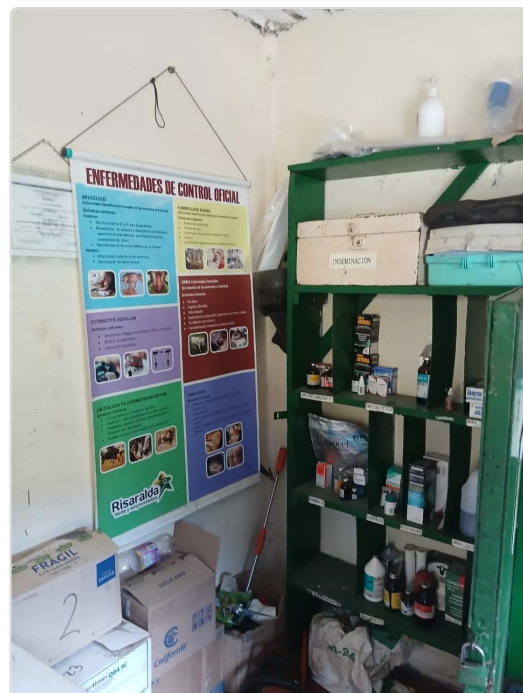
Figura 8. Botiquín de medicamentos.

El almacenamiento de medicamentos de este botiquín está destinado solo para aquellos productos se usarán en los animales especialmente para el tratamiento de bovinos, se encuentra clasificado según su campo de acción, cuenta con puesta y candado que permanece cerrado siempre, las jeringas guantes y otros elementos de trabajo son desechables en su mayoría y se encuentran separados en recipientes individuales para su fácil ubicación.