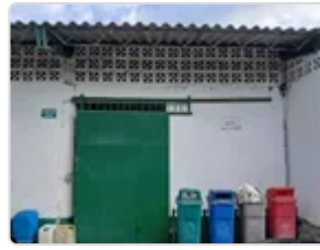
Figura 5. Imagen bodega de residuos sólidos.

La bodega permanece cerrada con llave todo el tiempo y solo es abierta para almacenar las basuras, chatarra, y otros elementos sólidos que se recolectan durante la limpieza de las instalaciones, estas son seleccionadas según su tipo y si son reciclables o no, todos los residuos son recogidos semanalmente por la empresa municipal de aseo y una empresa de reciclaje, que se encargan de la disposición de los residuos.