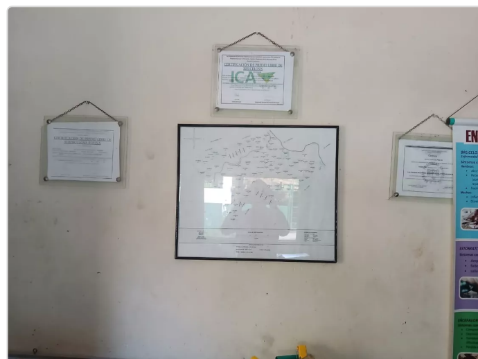
Figura 10. Imagen certificados y mapa de la finca.

En el momento el certificado de buenas prácticas ganaderas expedida por el ICA no se encuentra vigente hace tres años, pero si cuenta con los respectivos certificados de hato libre de brucelosis y enfermedades de control nacional expedido por él ICA, por otro lado, tiene las acreditaciones que entrega Colanta a sus proveedores de leche, en estas visitas a parte de verificar las buenas practicas ganaderas hacer algunos análisis a la calidad de la leche y pruebas a la salud de los animales, estas visitas se hace cada año y en algunas ocasiones se hacen revisiones periódicas de prevención.