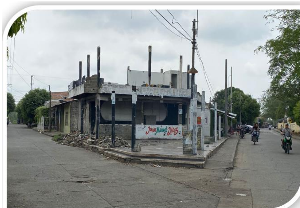
[Fotografía] de Huertas Yolima. (Sector La batería-Montelíbano, 2024) Biblioteca fotográfica. Colombia, Córdoba

En el Corazón de Montelíbano, donde muchos años sonaban los ritmos alegres, y los abrazos y carcajadas, llenaban el ambiente de todo el sector, hoy quedan solo ruinas y recuerdos de dolor, que se convirtieron en testigos mudos del conflicto violento que sigue azotando el municipio.