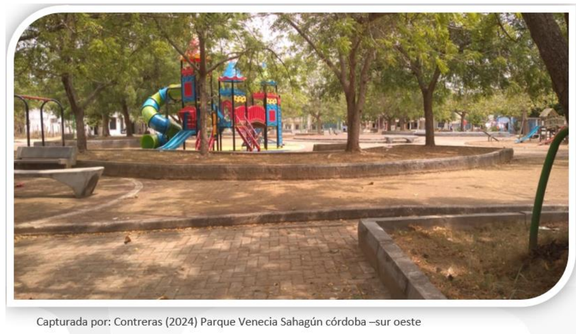
Parque Venecia Sahagún córdoba –sur oeste

La historicidad de un contexto urbano marcado por el conflicto de la violencia y las amenazas, donde los habitantes de barrios, sienten intimidación en ambientes que son de recreación y esparcimiento, el miedo asecha a consecuencia de presencia de panfletos amenazantes con objetivos militares a ciudadanos encontrados en estos espacios el cual se ven afectado por el pánico y la incertidumbre al frecuentar dichos ambientes ,condicionados por las dinámicas de violencia generando un clima de inseguridad y miedo a la comunidad local.