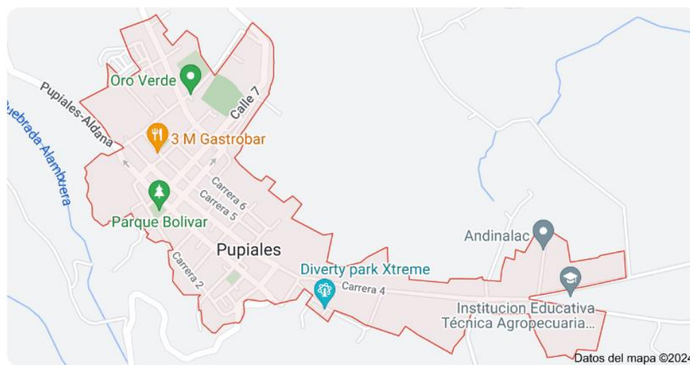
Figura 1 Mapa del Municipio de Pupiales, Nariño (Colombia) – Localización de Pupiales en Nariño