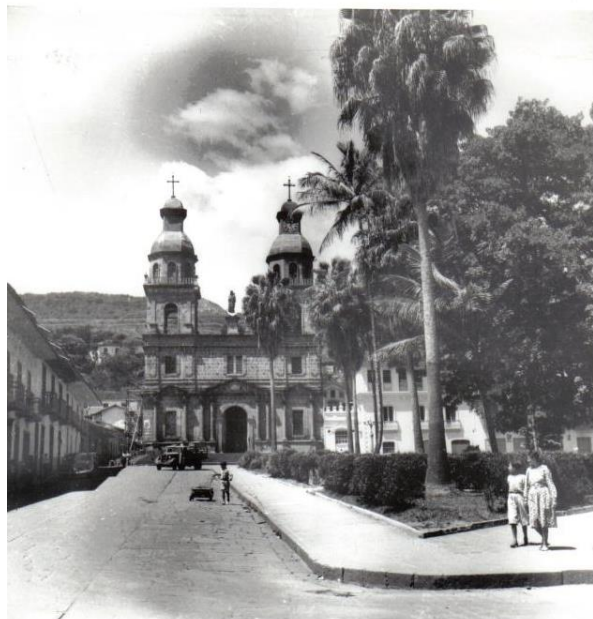
CATEDRAL DE SAN GIL 1950