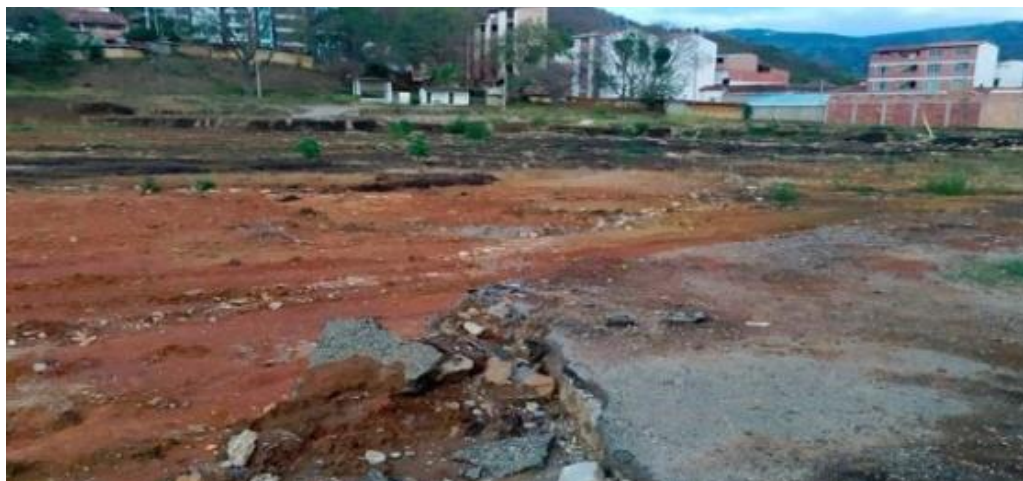
Foto de actual hospital regional de San Gil.