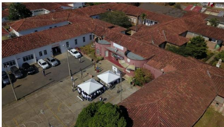
Foto de Antiguo Hospital Regional de San Gil