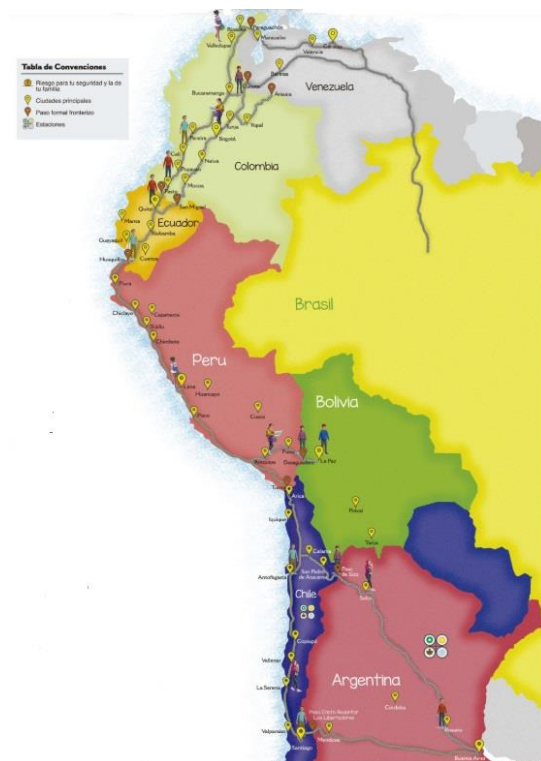
Figura 2. Colombia: Mapa rutas movilidad humana - R4V

recorrido más extenso, por vías de comunicación con condiciones más difíciles, a travesar selvas y no poseen una buena red de carreteras que les permita acceder rápidamente a otras naciones de Suramérica y Centroamérica; la otra salida es la marítima, pero Venezuela salvo Trinidad y Tobago, cuenta solo con islas vecinas de las antillanas, de muy pequeña extensión, baja población y elevados costos para desplazamiento a otras naciones. Por todo lo anterior, Colombia y más exactamente, Villa del Rosario y Cúcuta se convierten en una excelente opción para su migración, donde las extensas rutas de caminatas tienden a ser el método más utilizado ante los costos de desplazamiento que para el venezolano es muy difícil de costear (ver figura 2), o, en caso tal, de establecerse en dichos municipios con el fin de estar muy cerca de su país natal.