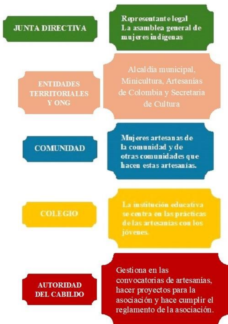
Figura 2 Conjunto de Acción de la OSP