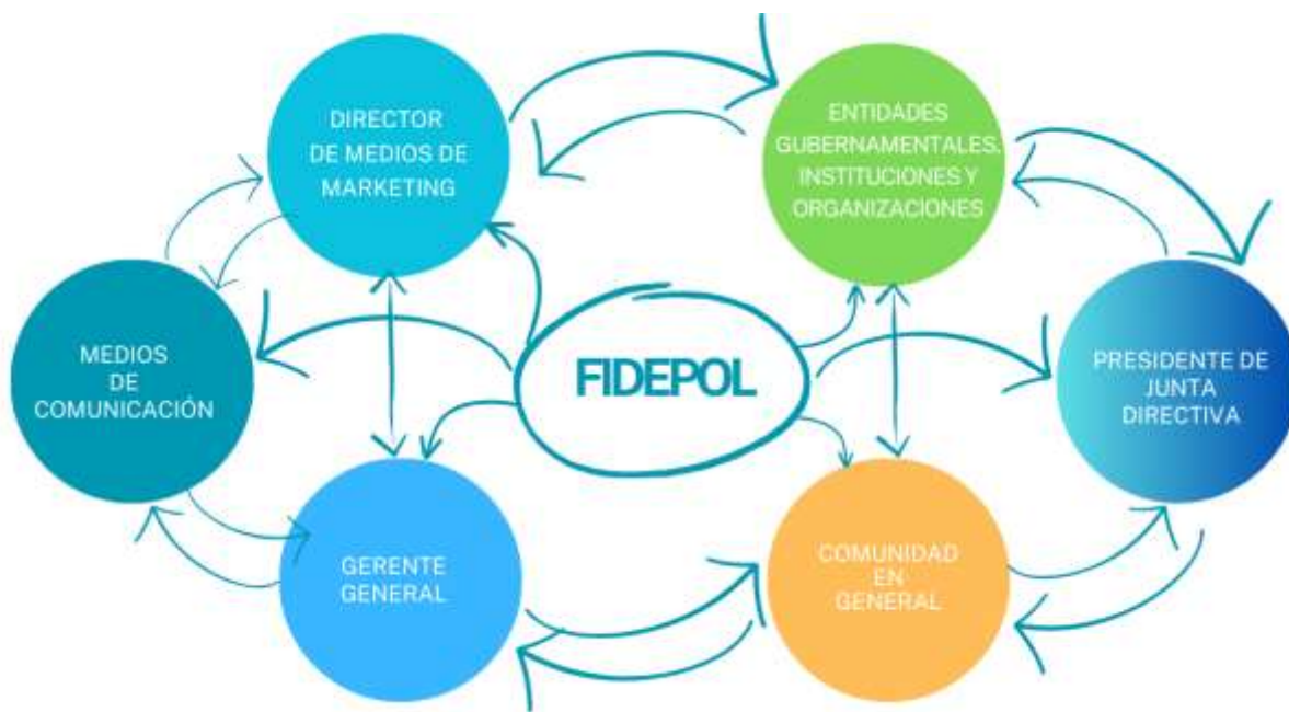
Figura 1 Sociograma Fundación FIDEPOL