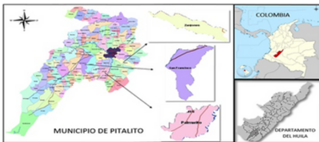
Figura 2. Localización del área de estudio.

El tamaño de su población de acuerdo con el último censo DANE 2005, en total del Municipio es de 109.375 habitantes, distribuidas 64.082 en el área urbana y 45.293 en el área rural, extensión total de 666 Km 2 , altitud de la cabecera municipal 1000-1800 msnm, temperatura media de 18 y 21°C; sus principales generadoras de ingresos son el sector Agropecuario, el Comercio informal y la Prestación de Servicios (Alcaldía de Pitalito, 2015).