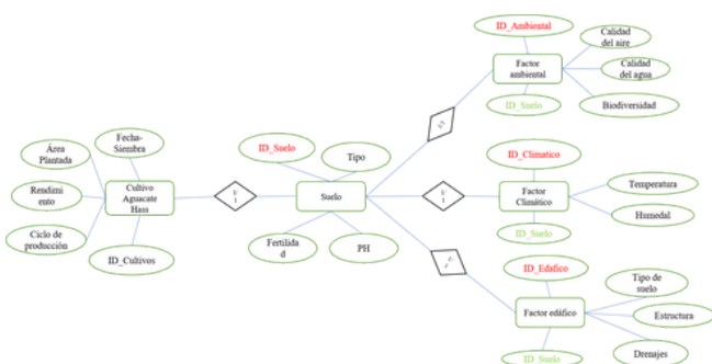
Figura 1. Modelo Entidad – Relación.

La problemática identificada en el municipio de Pitalito, Huila mediante el estudio de los Sistemas de Información Geográfica es la determinación de la vocación de sus suelos en el cultivo de aguacate Hass ( Persea americana Mill ), ya que está relacionada con varios aspectos importantes como las características físicas, químicas, biológicas y ambientales del suelo para lograr una caracterización de los suelos y así identificar la idoneidad y capacidad de soporte para este cultivo en específico.