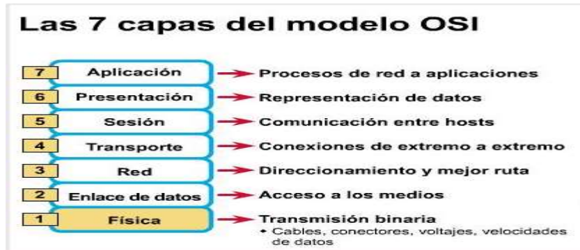
Figura 2. Capas del Modelo OSI.

94 Fuente Informática Medica. Protocolos de comunicación. 2021. Disponible en http://informaticamedicaipn.mex.tl/1589954_protocolos-de-comunicacion.html