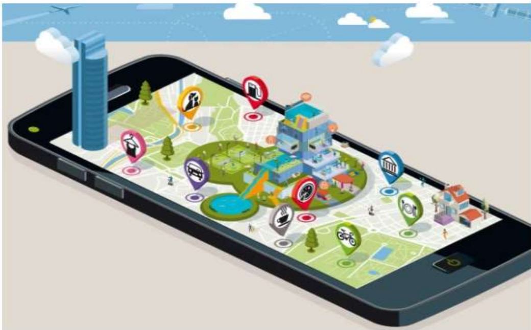
Figura 1. Redes de Sensores

Refiere a una tecnología que ayuda a la creación de ciudades inteligentes, crea nodos con captores inteligentes, pueden recoger y transmitir información sobre su entorno. 58