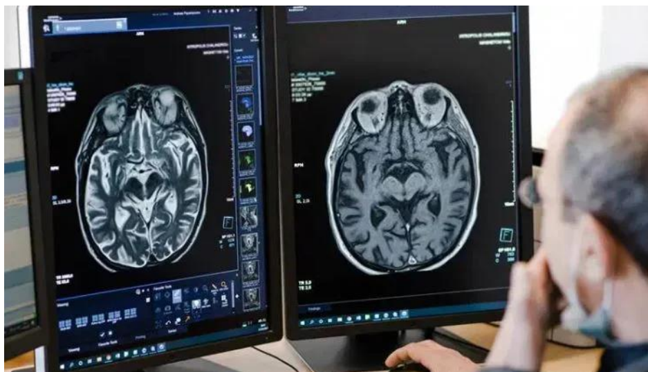
Imagen Inteligencia Artificial en Radiología

Nota. Inteligencia Artificial en Radiología para obtener respuesta Médicas más Eficientes.