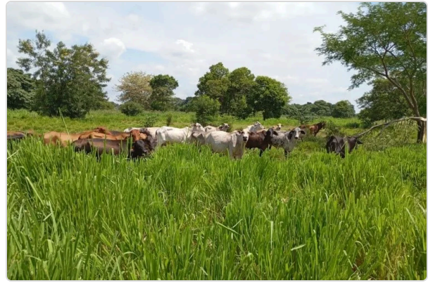
Figura 3. Bovinos en pastoreo