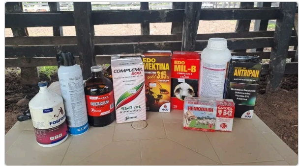
Figura 5. Uso de medicamentos