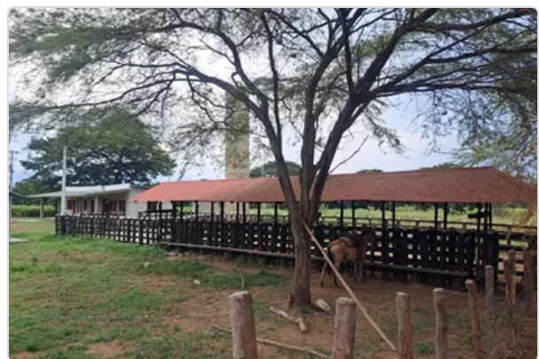
Figura 2. Instalaciones de la finca

La finca Táchira cuenta con todas las instalaciones de acuerdo al sistema productivo, para evitar accidentes que afectan la integridad física y sanitaria de los animales, garantizando de esta manera el bienestar animal y las condiciones que permitan mantener la higiene y bioseguridad de las mismas, que les facilitan a los operarios un adecuado manejo para el tratamiento de los medicamentos para los animales, corral, manga, techo de acuerdo a las normas establecidas por el ica la finca cuenta con potreros o corrales de asilamiento para los animales que requieren tratamiento veterinario y manejo especial para evitar la proliferación de enfermedades contagiosas