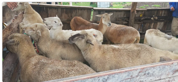
Figura 3. Produccion Finca los Arrieros

La práctica de la esquila es un aspecto muy importante las producciones Ovinas y caprinas