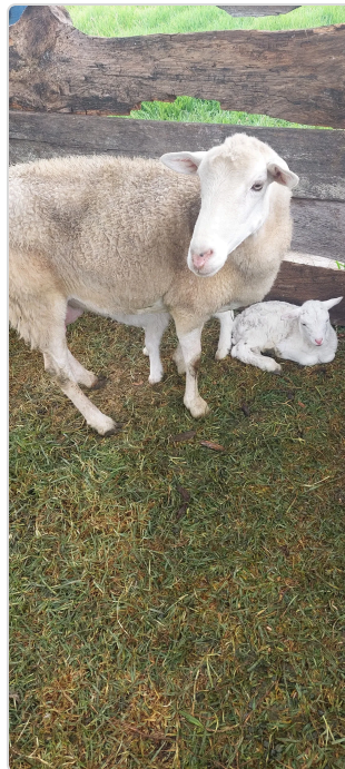
Figura 2. Cría de oveja

Pasto kikuyo fresco a voluntad (en pastoreo) 1 @ de concentrado marca Italcol para el total de los animales, es decir 0,625 Kg x Animal al día. 1 lt de agua por animal/ día