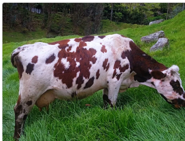
Figura 5. Holstein.