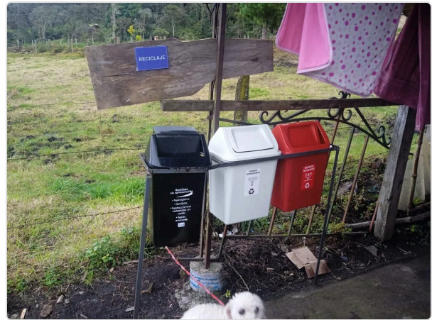
Figura 9. Color de tanques de basura.