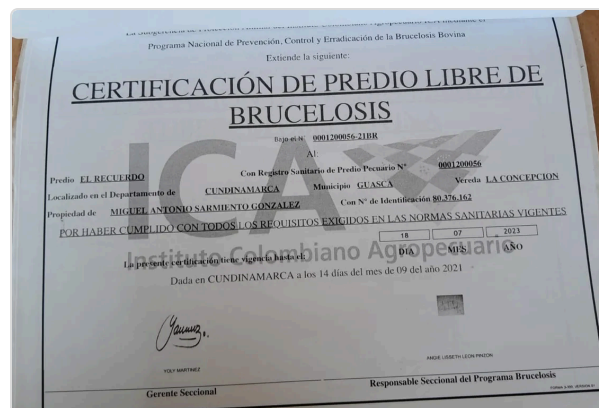
Figura 6. Predio libre de brucelosis.