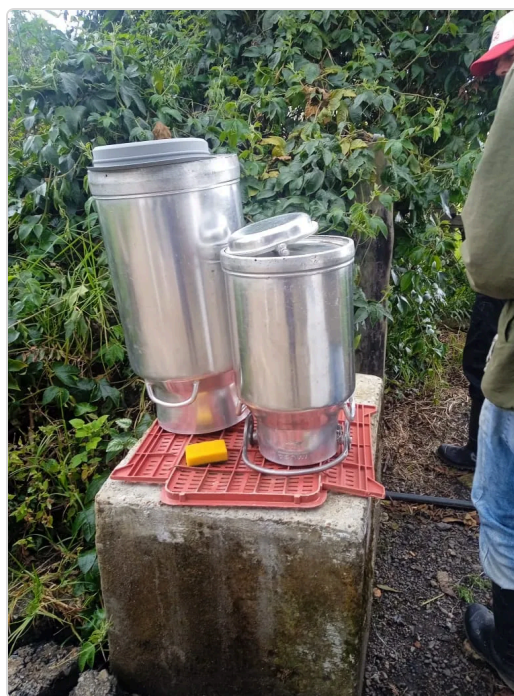
Figura 7. Limpieza de las cantinas.

Contar con un procedimiento de ingreso, aislamiento y cuarentena de animales, tiempo de 21 días.