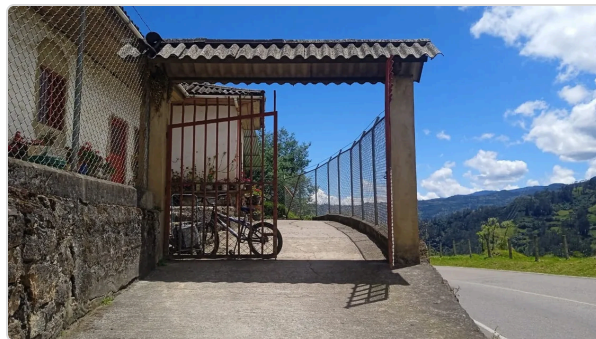
Figura 8. Entrada.

Proporcionar área de casilleros para guardar ropa u intensillos personales.