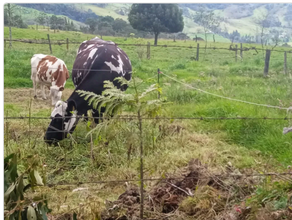
Figura 4. Alimentación.

Objetivo es leche y sus derivados lácteos.