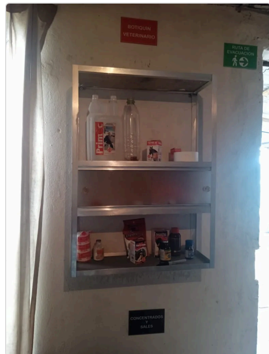
Figura 3. Medicamentos veterinarios.

Procedemos a la parte del establo donde conozco el manejo y función de los animales y su adecuado procedimiento, el animal se encuentra en buen estado y no tiene maltrato alguno, seguimos con las praderas donde los bovinos están en pastoreo constante, el propietario nos cuenta que el único problema que tiene con los parásitos es la garrapata, pero llevan a cabo el respectivo tratamiento de aplicar coopersol, esto ayuda que el bovino no tenga molestia alguna de la garrapata.