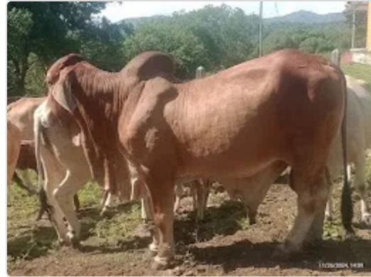
Figura 2. Parental Bovino (Raza Brahaman)