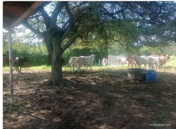
Figura 3. Hembras Fincas El Amparo