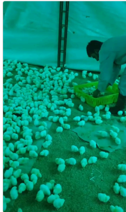
Figura 2. Descargue del pollo de 1 día de nacido de la granja Luna verde .

Luego se instalan y revisan las incubadoras que proveen la temperatura adecuada para el óptimo desarrollo de los animales. se configuran las cortinas que impiden la entrada de aire frío al galpón.