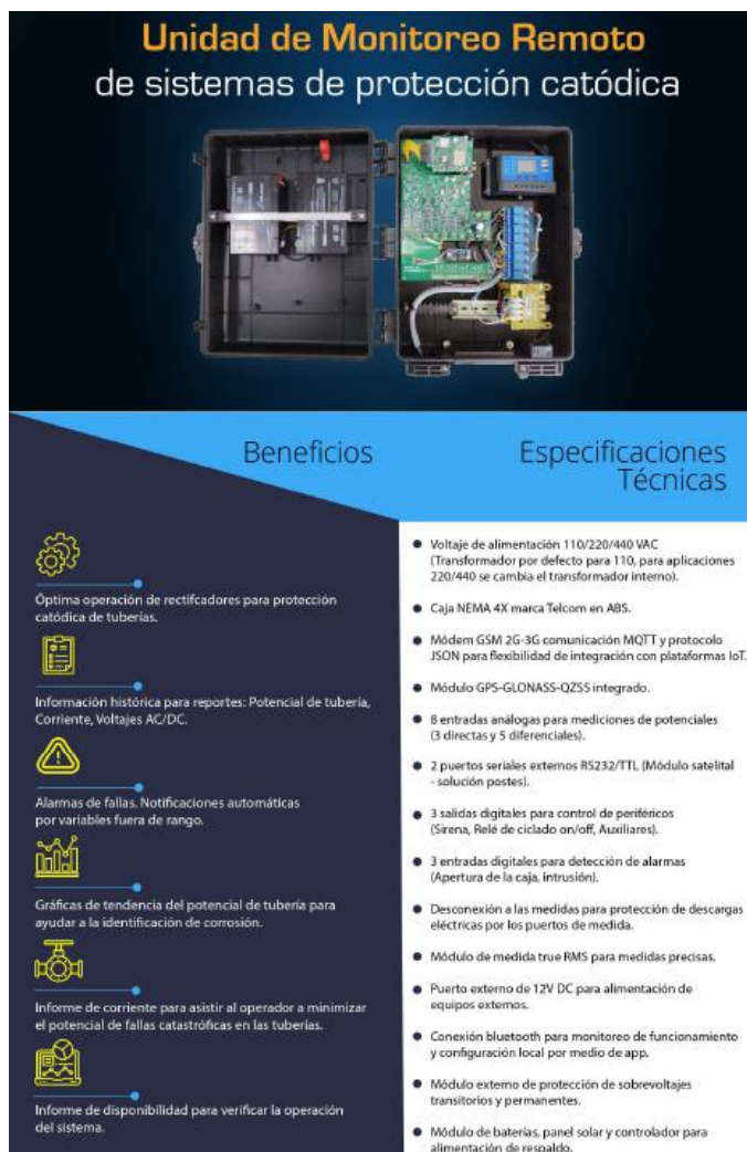
Figura 2: Ficha técnica Unidad de Monitoreo Remoto. Elaboración Propia