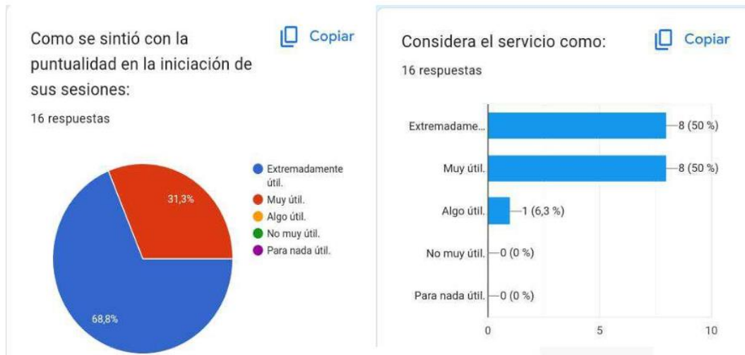
Gráficos 3 y 4, tomados de Vega et al

Con los gráficos anteriores presentado por las practicantas en el año 2023, podemos observar que de 16 participantes que realizaron la encuesta de satisfacción, el 50% contestaron con el máximo puntaje, con de extremadamente interesante la atención recibida, y con el otro 50% contestaron que les pareció muy útil la atención recibida. Se puede ver más gráficos de resultados en apéndices, donde muestran la participación activa de los estudiantes convocados a la atención del programa COPE.