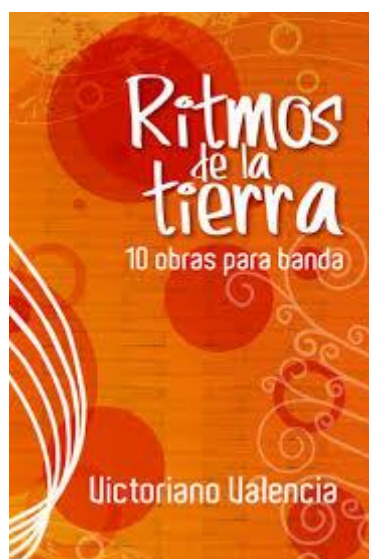
Figura 1 Colección Ritmos de la tierra

Nota: Portada colección “Ritmos de la tierra” Victoriano Valencia Rincón