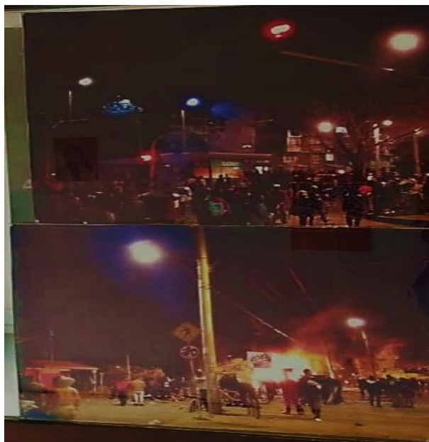
Imagen de Protestas del Día 9 de Septiembre de 2020 Expuesta en Galería de La Casa de la Memoria Suba

Nota. Imágenes expuesta en la galería de La Casa de la Memoria Suba que evidencia la magnitud de los acontecimientos durante las protestas ante el abuso policia que llevo al fallecimiento de Javier Ordoñez.