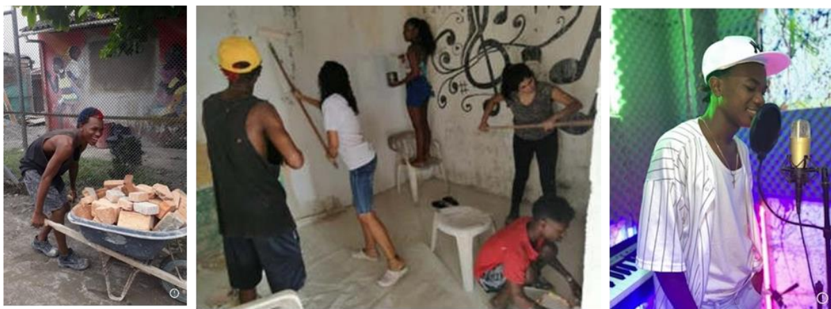
Purrer, U. (2020). Remodelación estudio de grabación.

En el año 2022, viajaron a Alemania. Siendo uno de los ganadores en el concurso internacional EINE WELT SONG CONTEST 2021, financiado por el Ministerio de Cooperación Internacional de Alemania. Participaron más de 600 solistas y agrupaciones de todo el mundo, y AfroMiTu quedó entre los 20 finalistas, con su canción “Respeto a la Vida” ganando la posibilidad de viajar Alemania para grabar la canción de manera profesional y realizar varias presentaciones en algunas ciudades de Alemania. Este viaje fue muy significativo para la agrupación, ya que se crearon alianzas y redes de apoyo.