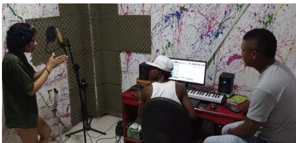
Rodríguez, E. (2023). Grabación de canción "Secuelas de una Inocencia"