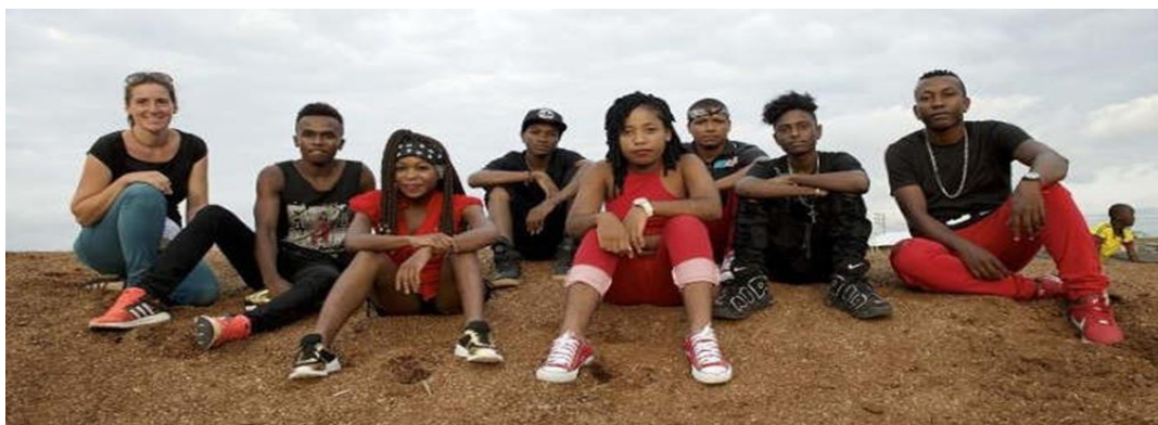
Navas, C. (2017). AfroMiTu