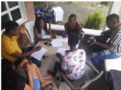
Purrer, U. (2022). Redacción de canción “Naturaleza Viva”