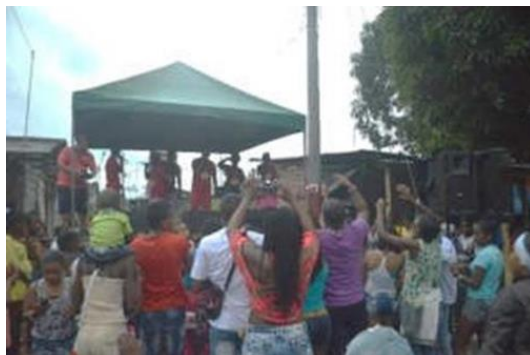
Purrer, U. (2015). Primer concierto al barrio.