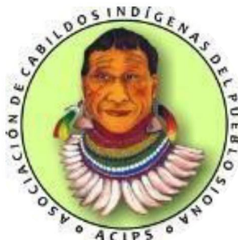
Figura 1 Logo de la ACIPS