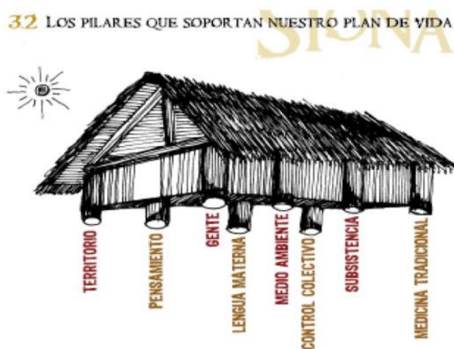
Figura 2 Los Pilares que Soportan el Plan de Vida de los Siona