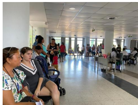
(Fotografía: Beltran,L. Firmas de Actas, 2024)