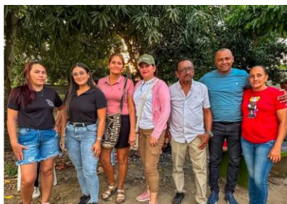
(Fotografía: Beltran,L.Conformación de Veeduría, 2024)