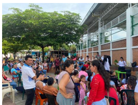
(Fotografía: Beltran, L. Socialización del programa R.C, 2024)