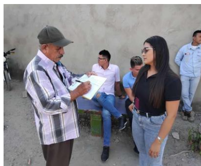
(Fotografía: Beltran,L.Conformación de Veeduría, 2024)