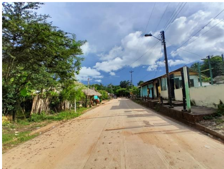
Calle larga del Anclar

Nota. La figura presenta una calle del municipio del anclar. Elaboración propia