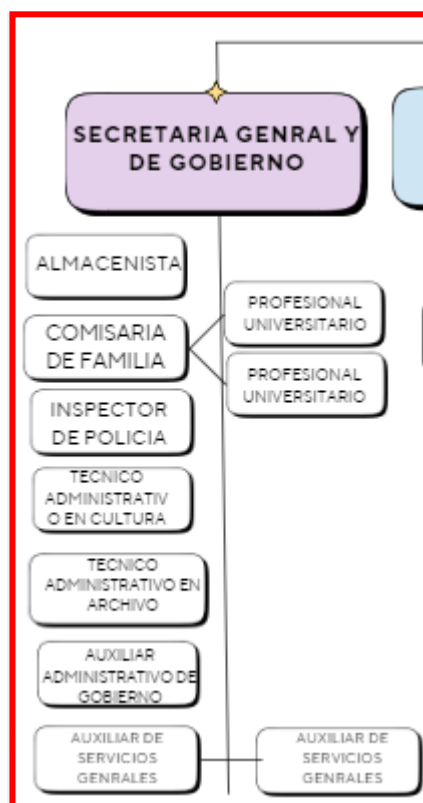
Ilustración 3: Organigrama Secretaria General y de Gobierno