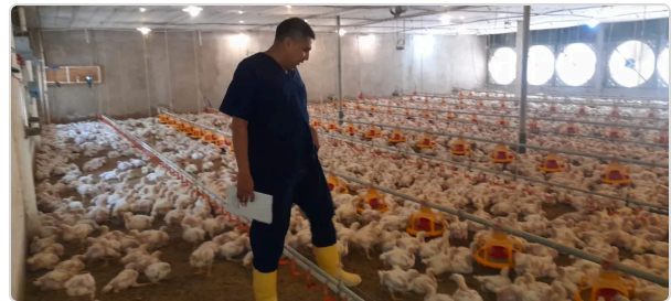
Figura 3 visita a la Finca las Delicias

La Granja Las Delicias opera bajo un sistema intensivo de producción de pollo de engorde, con una capacidad instalada para albergar 50,000 aves. Cuenta con 3 galpones de ambiente controlado, donde se manejan aves de la línea genética Cobb500. El ciclo productivo se extiende hasta los 40 días, momento en que las aves alcanzan el peso comercial requerido por la empresa integradora.