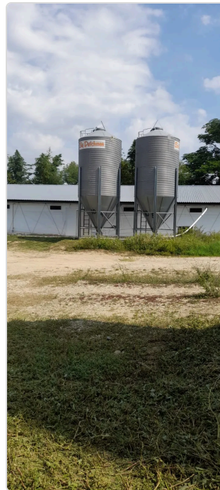
Figura 4 Silos de almaceamiento de concentrados para las aves

Se mantiene un inventario actualizado de alimentos y materias primas. La estrategia nutricional se ajusta a los requerimientos específicos de cada fase productiva, factor determinante para alcanzar los indicadores de conversión alimenticia y ganancia de peso esperados.