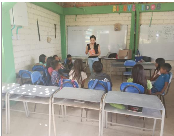
Juego Dado de Emociones