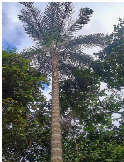
Palma de chontaduro

Nota: La figura ilustra la palma de chontaduro, espacio de construcción de leyendas.