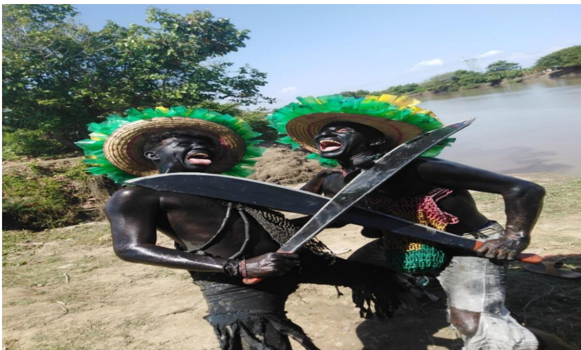
Figura 2 Personajes del Son de Negro

hombres y mujeres de la zona del Canal del Dique y el Bajo Magdalena; esta tradición oral, se desarrolla en un mismo marco geo – histórico y ceremonial, en el cual se le da rienda a la diversidad rítmica – musical, danzaría y bailes coreográficos revestidos de silueta natural en espacios planimetricos. (Herrera, 2010)