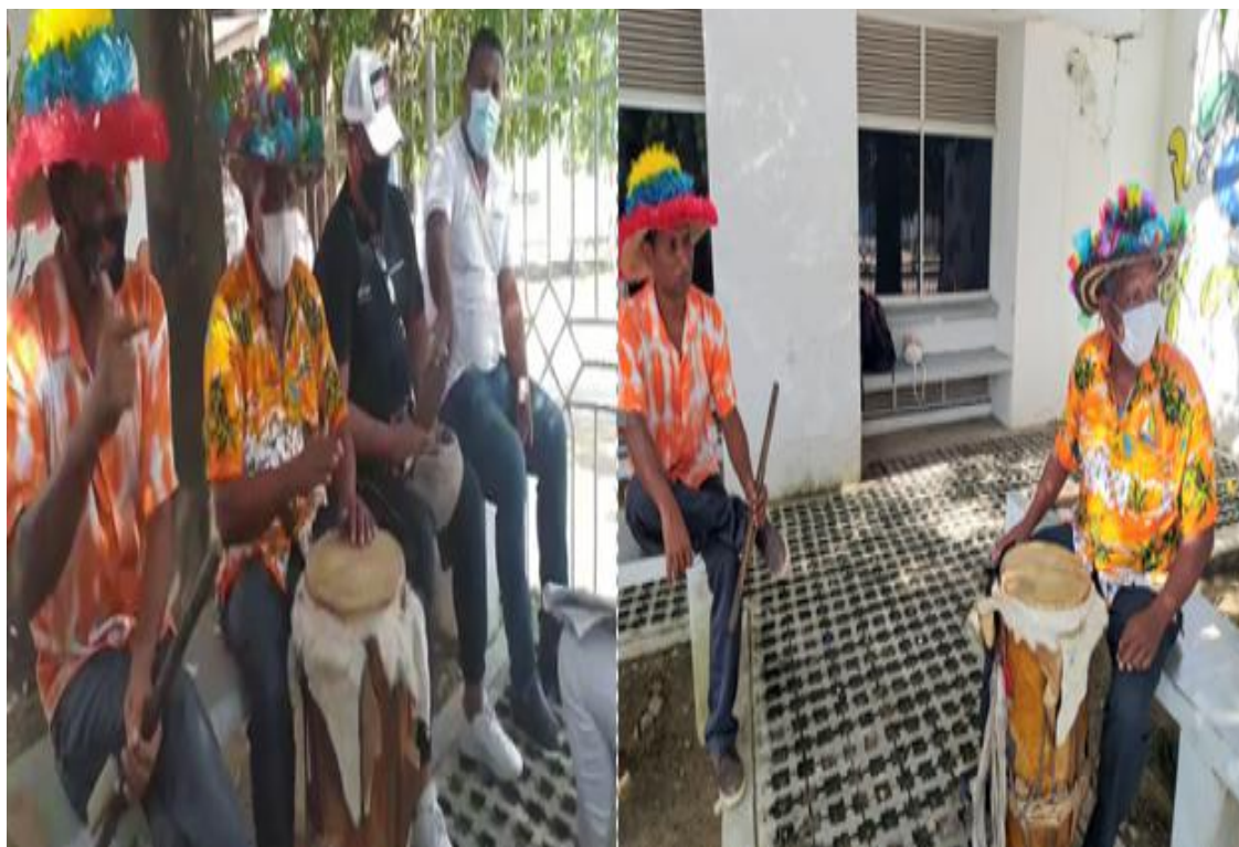
Figura 3 Hacedores culturales

con trajes tradicionales, realizan movimientos enérgicos y expresivos que reflejan la rica herencia cultural africana.