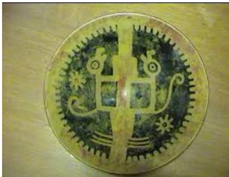
Figura 7 Mito las dos perdices