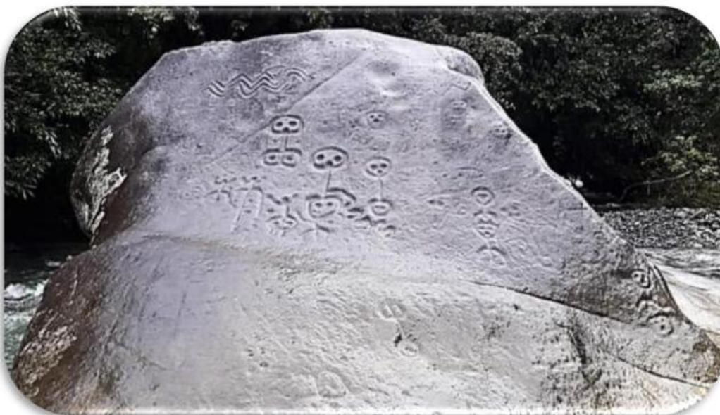
Figura 6 Piedracara

El mundo de arriba, el mundo de las nubes y el viento, de los y las mayores, de los grandes abuelos cerros y abuelas montañas, de los médicos y de los dioses. Del sol, la luna y las estrellas. El mundo del medio donde están los animales, las plantas y nosotros como seres de caras, aquí están las fiestas, la casa, el fuego, el alimento y el calendario circular. 6 el mundo de abajo donde está la madre tierra y la abuela agua, principio y fin de vida, donde está la conexión con todos los seres y que van al inmenso. Las raíces y los difuntos. Nuestro gran árbol de la vida, nuestro Kiru, nuestro Ti, de donde heredamos hoy las 21 ramas del Buen Vivir. Es la piedra nuestro génesis, ley de origen y ley natural. Es nuestra piedra sagrada, la piedra de las diversas caras, la PIEDRADECARA. Voces de los abuelos Astarón, río Cristal y Piedracara (Lagos, 2021)