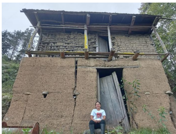
Figura 10 Las paredes también guardan memoria histórica