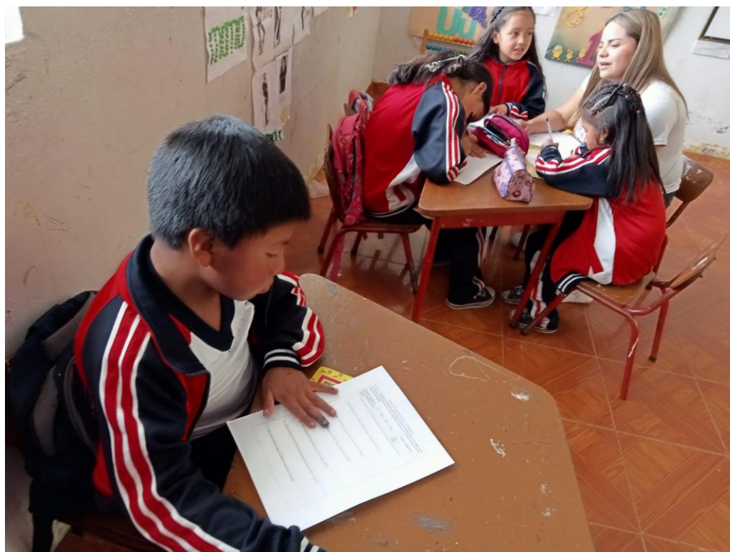
Figura 9 Recordando e identificando la ancestralidad