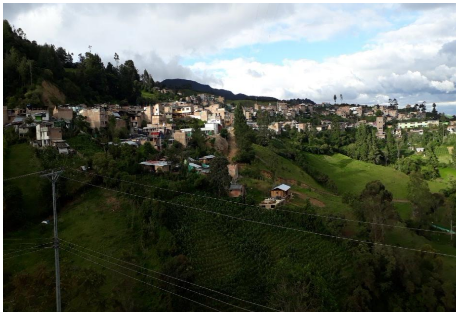
Figura 3 Pueblo de los pastos Municipio de Santacruz