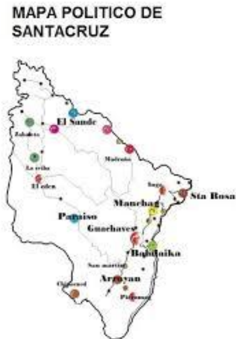
Figura 1 Mapa Político del Municipio de Santacruz