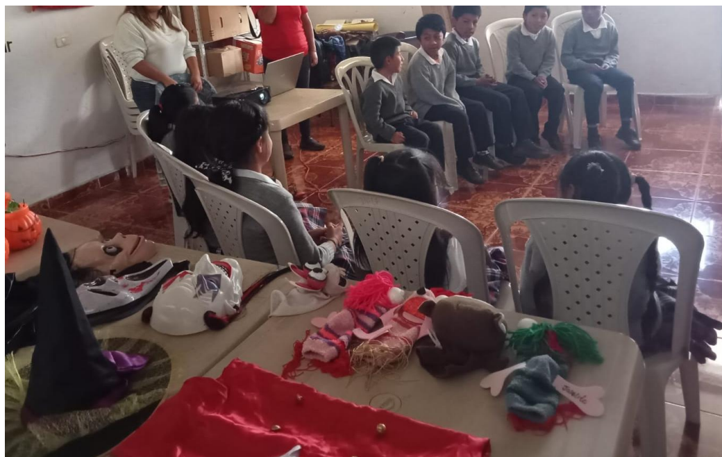
Figura 8 Identificando palabras propias con los estudiantes