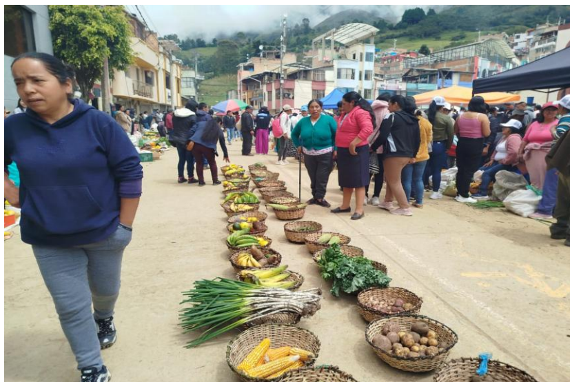
Figura 4 Productos agrícolas del Municipio de Santacruz- Pueblo de los Pastos