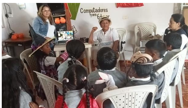
Figura 10 Mitos y leyendas de sabedores de la comunidad San Martin