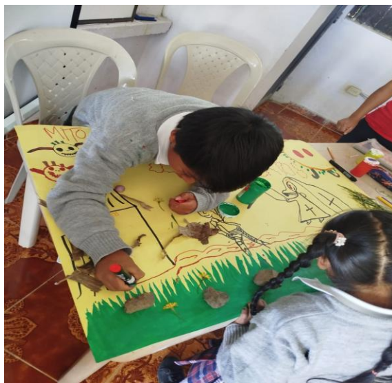
Figura 11 Recopilando e identificando saberes.