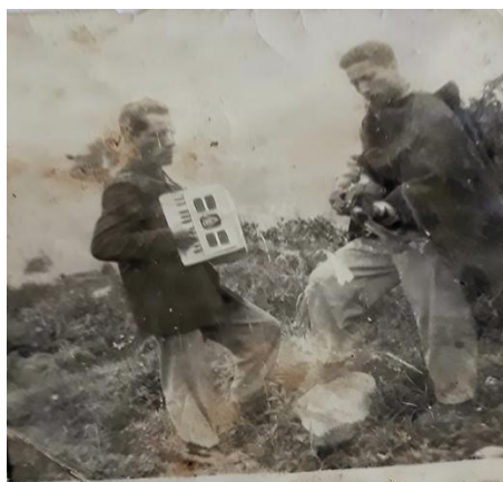
Figura 11 Los artistas de las fiestas patronales hace muchos años atrás