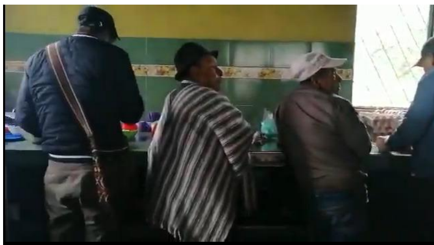
Figura 2 Fortaleciendo la Tradición Oral