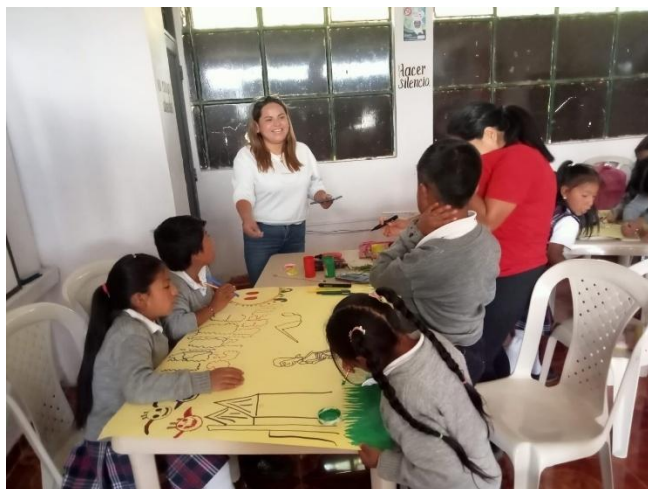
Figura 12 Aplicando la creatividad para la creación de mitos y leyendas