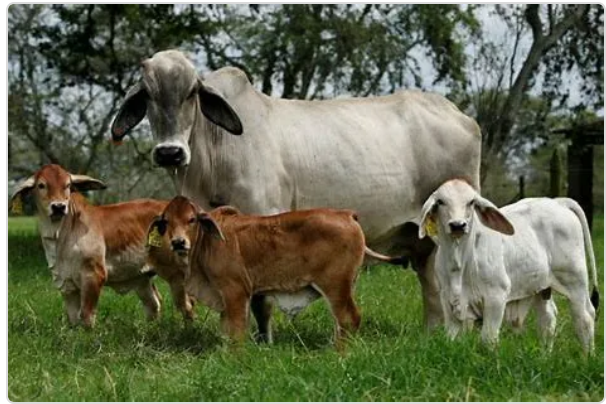
Figura 2. Terneros de Levante .

Es por ello que se debe garantizar la identificación única e individual de los animales, y llevar a los registros en el predio, de todos aquellos eventos relacionados con los animales durante el desarrollo de su ciclo productivo. La Finca El Rodeo cuenta con sistemas de marcación, el cual es utilizado en los bovinos para el manejo y utilización de registros individuales: los registros se realizan físicos y luego se incorporan en un software ganadero para el análisis y toma de decisiones.