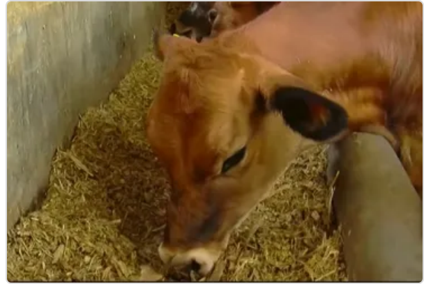
Figura 4. Nutrición Ternero Levante

En la finca El Rodeo el profesional Zootecnista lleva los controles que aseguren la cantidad y calidad de los alimentos de los animales se procura una alimentación balanceada, donde prima la alimentación con forrajes, teniendo en cuenta que los bovinos son ruminantes y son estos los más económicos, a esto se suma la suplementación con diferentes productos agrícolas producidos en la misma explotación y algunos suplementos como sales minerales, melazas, vitaminas adquiridos de proveedores certificados o fuentes confiables. Se llevan controles estrictos sobre las proporciones que se ofrecen a los animales y se efectúa un control de peso según la etapa de crecimiento.