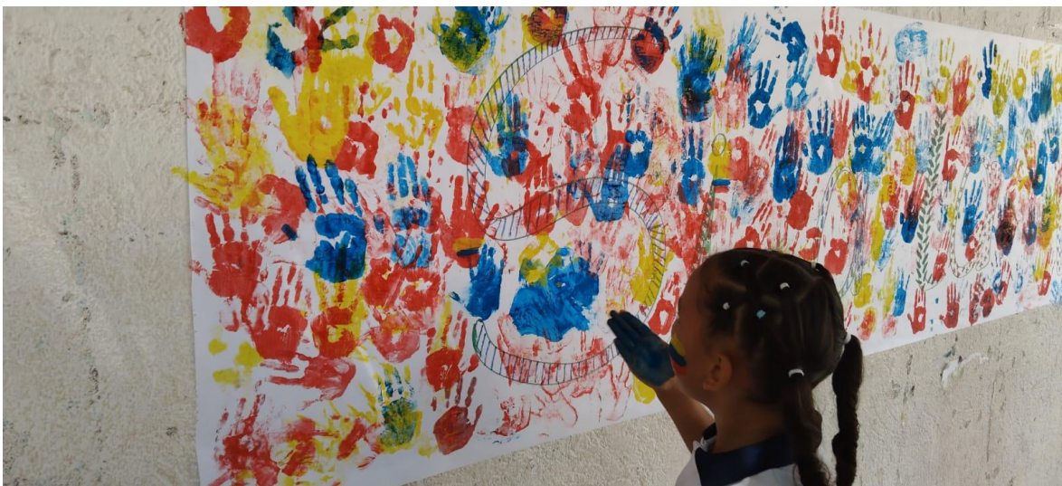
Padres de familia participantes del taller 2.