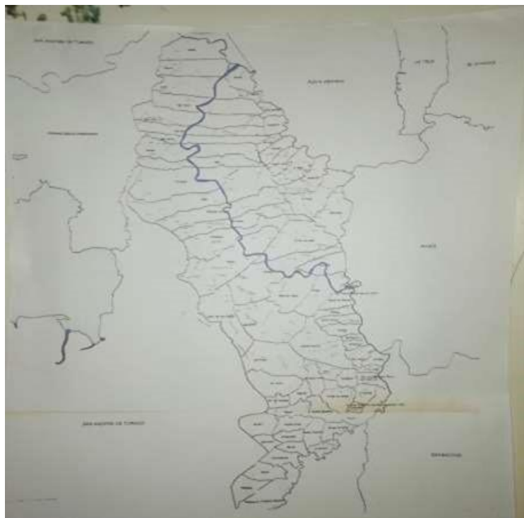
Croquis Municipio de Roberto Payán