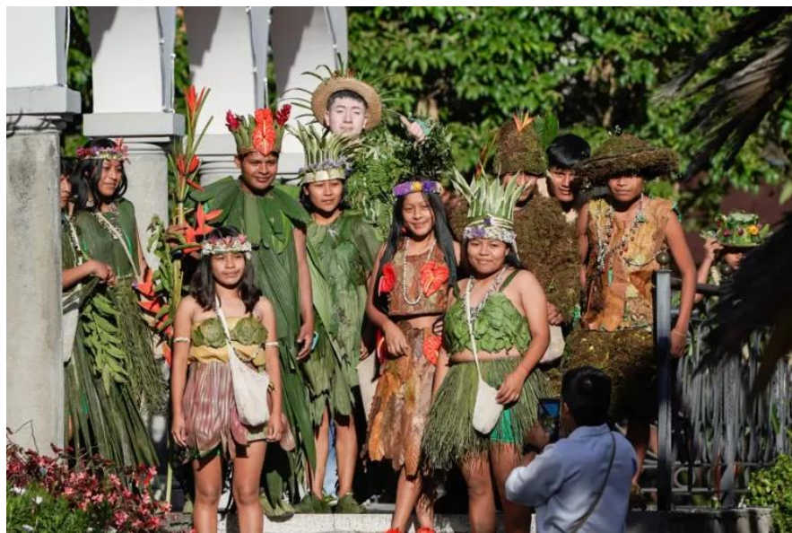
Ilustración Miembros Comunidad Awá (Nariño)