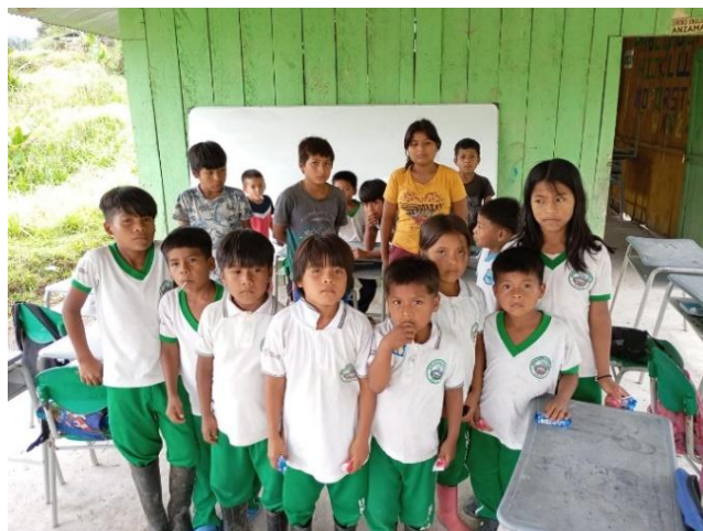
Educandos participantes de la comunidad Awa