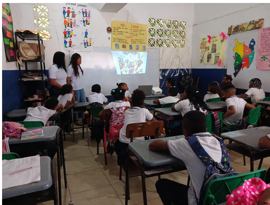
Proyección de videos con ejemplos de mitos y leyendas del municipio.