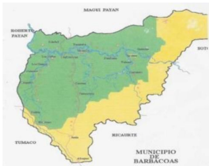
Mapa Municipio de Barbacoas