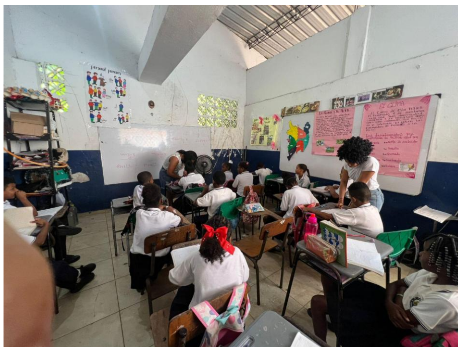
Acompañamiento de los alumnos en el proceso de aprendizaje.