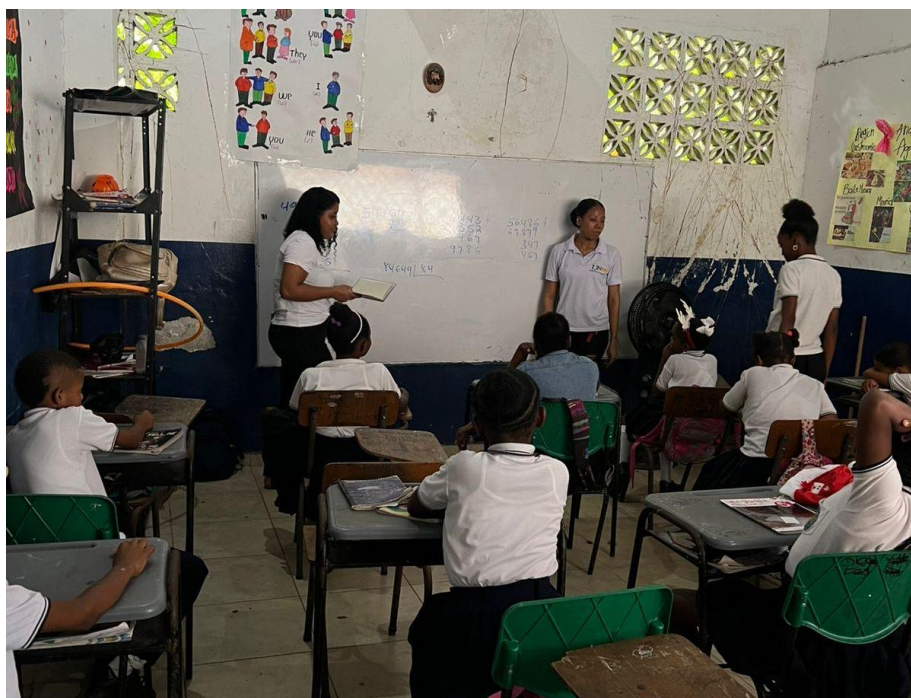
Estudiantes en el aula durante una lección.