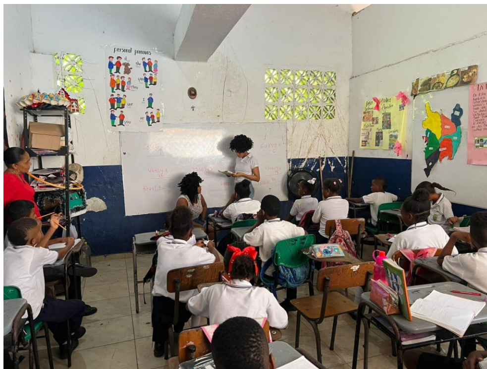
Lecturas de los mitos y leyendas del municipio.