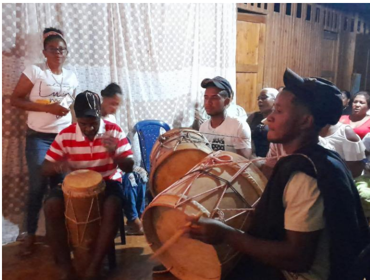
Acompañamiento a los arrullos tradicionales