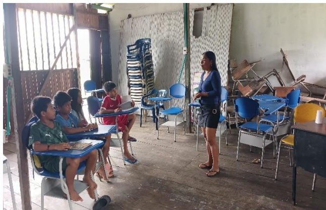
foto 2: de trabajo de diario de campo con grado 4. S.E. Tórtola Fecha: 2 de octubre de 2024

Registre el link del drive del archivo de evidencias de la sesión o proceso. Estas pueden ser: fotografías de los trabajos realizados por los integrantes de la comunidad educativa, listado de asistencia a clases, encuestas, entrevistas, fotografías y/o videos (tener en cuenta el consentimiento informado para fotografías y/o videos)