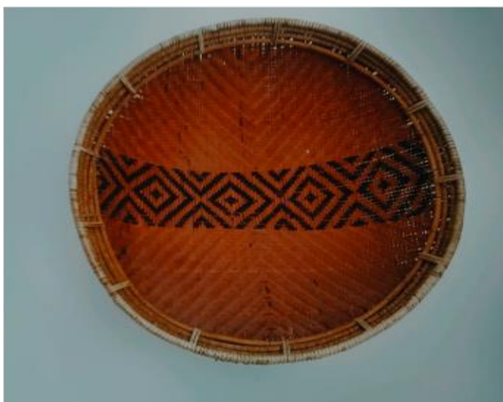
Ilustración 16 La cestería chitarera.