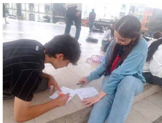
Ilustración 22 Realización de los dibujos.

Página Wix https://cindylicano2502.wixsite.com/reconstruccion