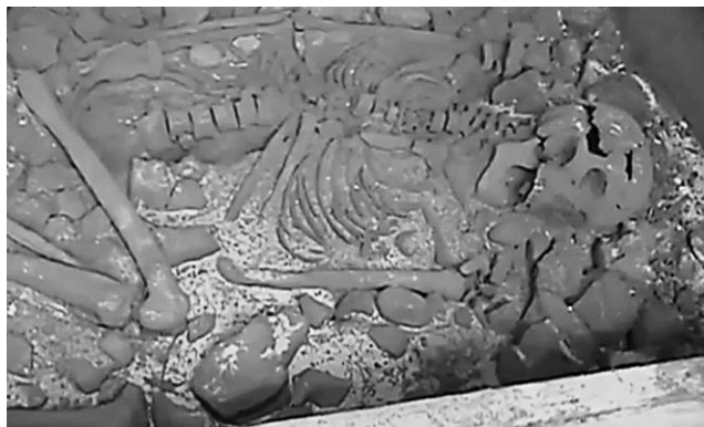
Ilustración 6 Sepultura Indígena.