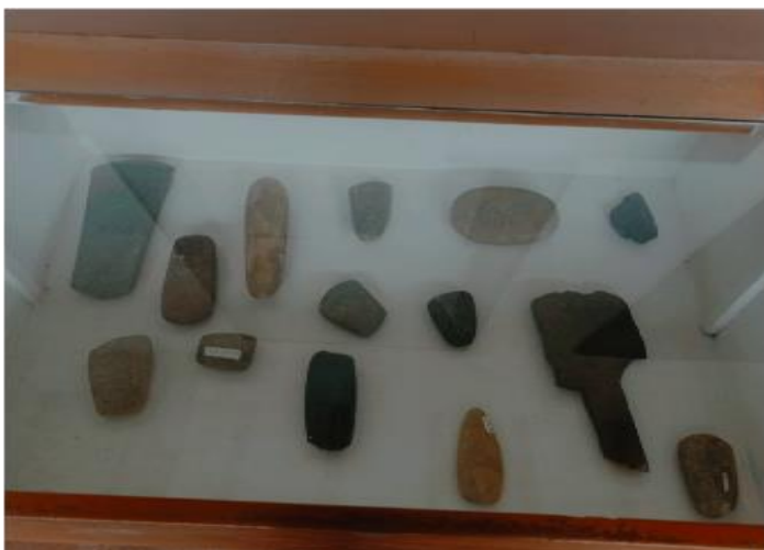
Ilustración 14 Piedra Echa por los Indígenas Chitareros Piedras de Caracol y Piedras que Utilizaban para Utensilios de Cocina.