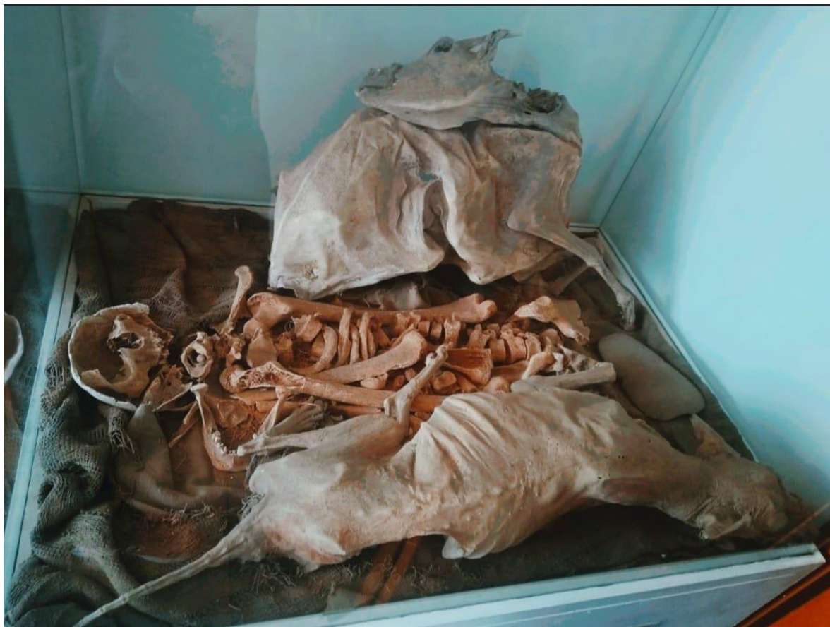
Ilustración 17 Se encuentran a una persona en posición fetal y algunos objetos de cerámica junto con sus perros.

Así despiden al indígena, llevándolo a su tumba junto con sus pertenencias más preciadas, las cuales acompañan el cierre simbólico de su ciclo de vida, para sellar la sepultura, se utilizan lajas de piedra, con las que culminan el rito funerario y honran su tránsito al más allá.