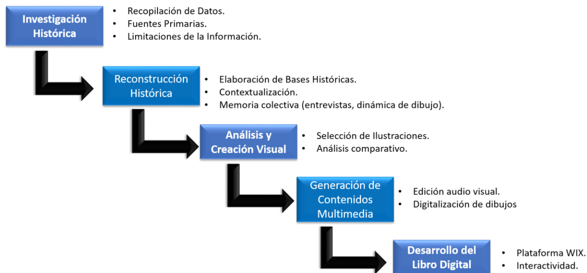
Ilustración 2 Metodología