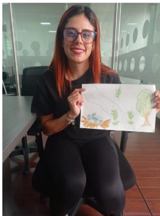
Ilustración 20 Evidencias de la actividad de re imaginar o de recordar sobre los chitareros.