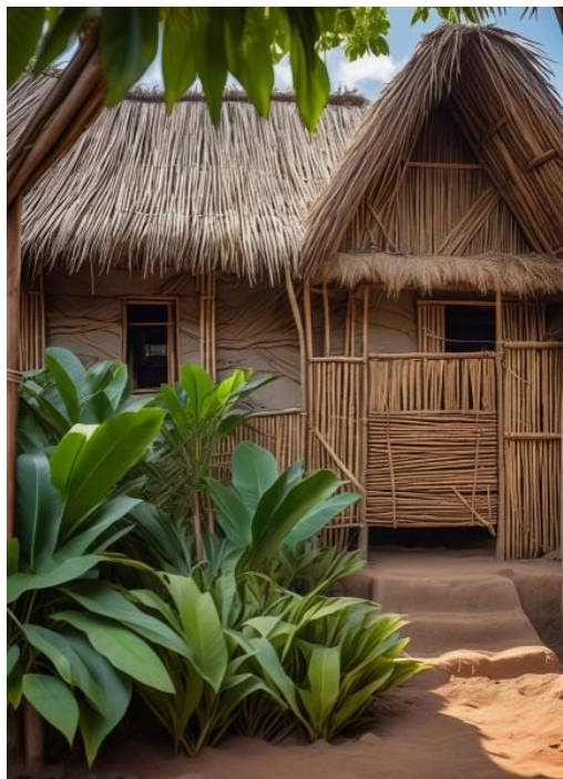
Ilustración 8 Casa chitarera en IA.

Se realizó una investigación dentro de algunos de los museos en la ciudad que contienen una significativa colección de artefactos pertenecientes a los pueblos indígenas locales, el análisis arqueológico y antropológico de estos elementos materiales reveló patrones significativos en el desarrollo tecnológico, las capacidades artesanales y las manifestaciones artísticas de estas culturas. La evidencia material, que incluye cerámica, textiles y herramientas, proporciona datos sobre el desarrollo socioeconómico y las dinámicas culturales de estas culturas precolombinas, permitiendo la reconstrucción contextual de sus sistemas de organización social y sus procesos adaptativos al entorno regional.