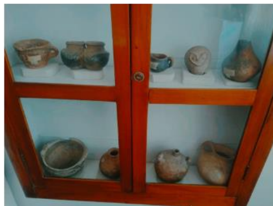
Ilustración 15 Alfarería.