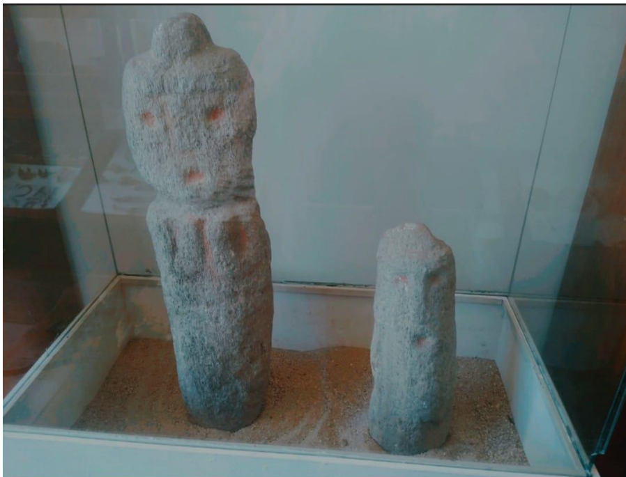
Ilustración 18 Figuras en piedra echa por los indígenas chitareros.