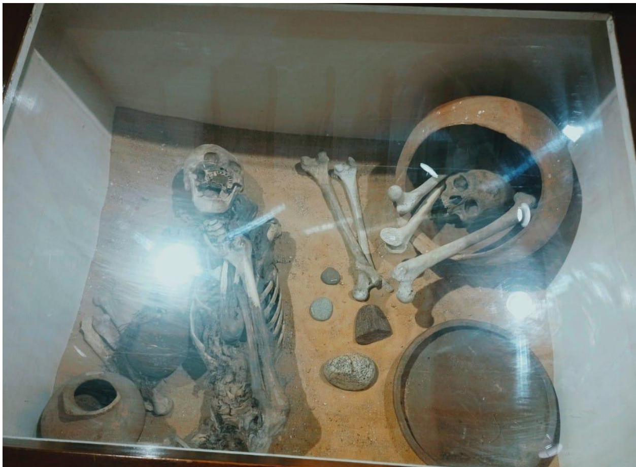
Ilustración 13 Cuerpos encontrados enterrados con alfarería piedras.