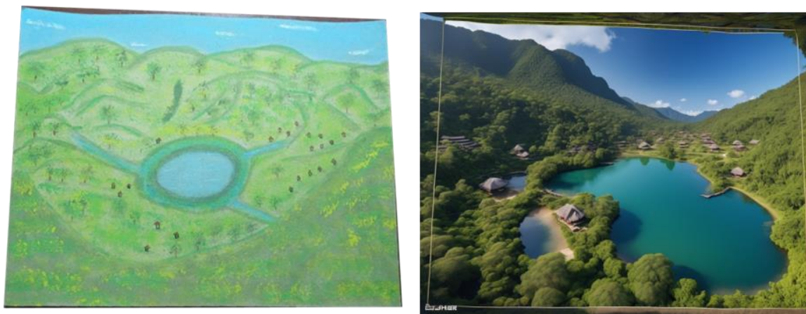
Ilustración 3 Valle De Hulago, Pintura, Elaborado en IA.

Estas imágenes sirven para contextualizar el uso de la tecnología al momento de generar representaciones de elementos artísticos y como a partir de pinturas es posible generar imágenes más realistas mediante el uso de IA o software de dibujo.