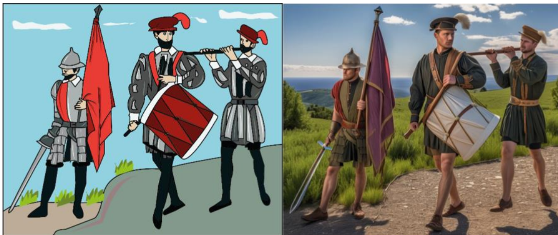
Ilustración 4 Tambores y Pifanos, Realizado en Adobe Illustrator, en IA.