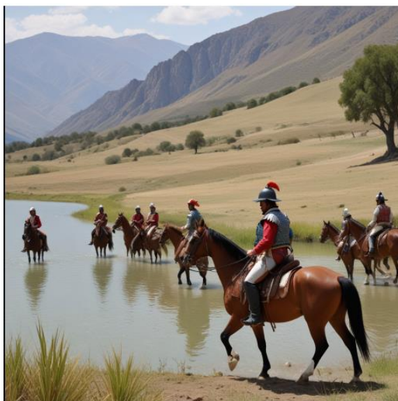
Ilustración 5 Soldados Españoles en el Valle de Hulago, IA.