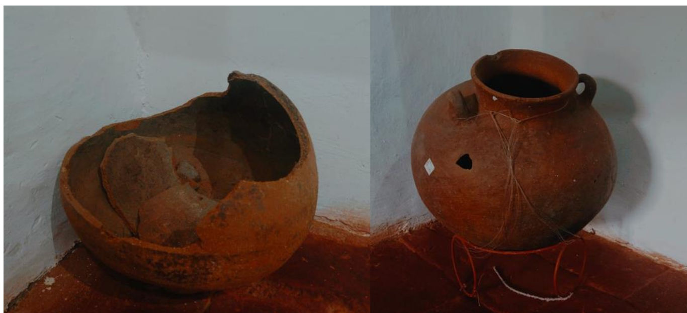
Ilustración 11 Alfarería Chitarera.