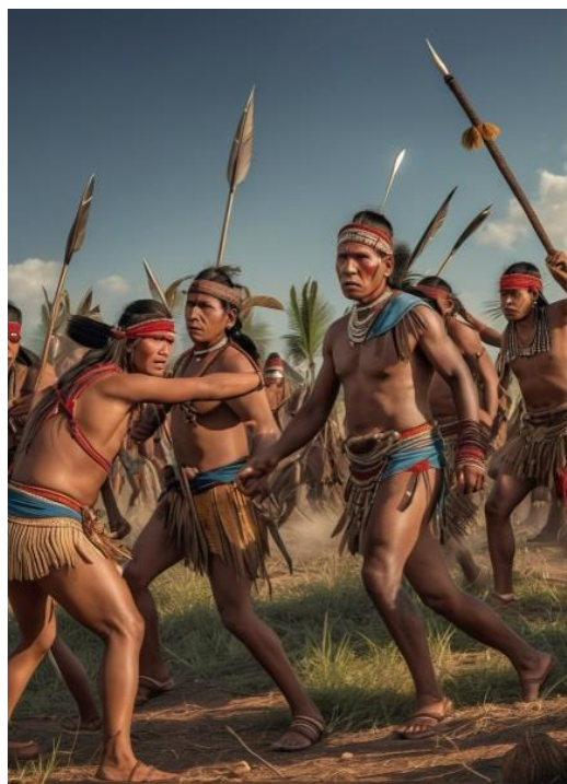
Ilustración 7 Indígenas chitareros en IA.