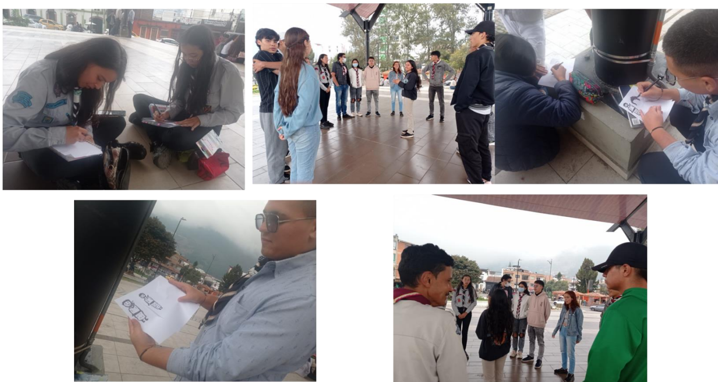
Ilustración 21 Charla sobre el tema y explicación de la actividad.

Se realizaron dinámicas participativas con un grupo de jóvenes scouts para darles a conocer la historia de los pueblos indígenas que habitaron la región, con especial énfasis en los Chitareros, durante la actividad, se incentivó a los participantes a reconstruir y reimaginar la memoria de este pueblo a partir de relatos históricos, culturales y recuerdos familiares, asimismo, se les invitó a compartir si alguna vez sus parientes les habían hablado sobre los Chitareros, promoviendo un espacio de diálogo sobre la identidad y el legado cultural de la comunidad.