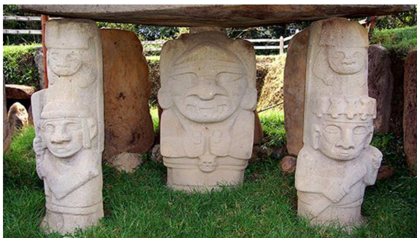
Ilustración 1

El Patrimonio Cultural alberga la memoria colectiva de las comunidades y representa la esencia misma de una nación, es responsabilidad del Estado garantizar el acceso a este patrimonio mediante medidas adecuadas de protección, preservación y, cuando sea necesario, restitución.