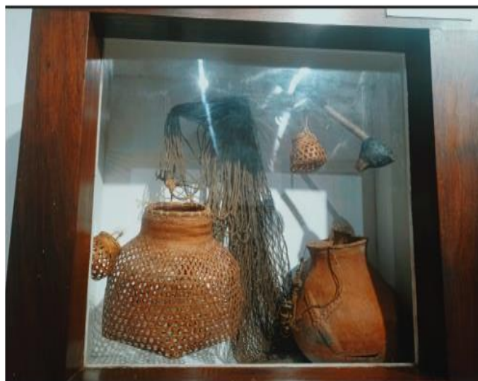
Ilustración 12 Arpones Manta Grupo Étnico chitarero y Herramientas de Caza y Pesca.