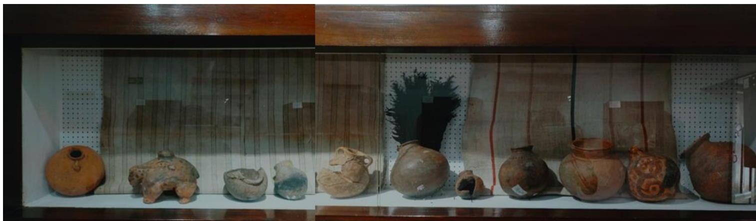
Ilustración 10 Alfarería chitarera.