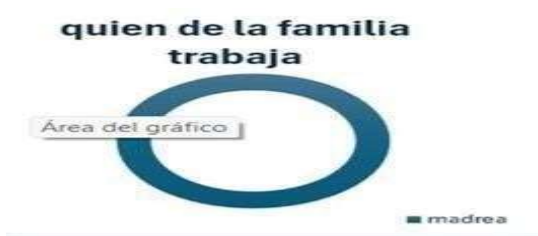
Figura 3 muestra de la persona que lleva el alimento al hogar.

Nota: la figura 3 muestra que es un solo miembro el que trabaja en este caso la madre dejando la mayor parte de tiempo solo a los jóvenes y adolescentes