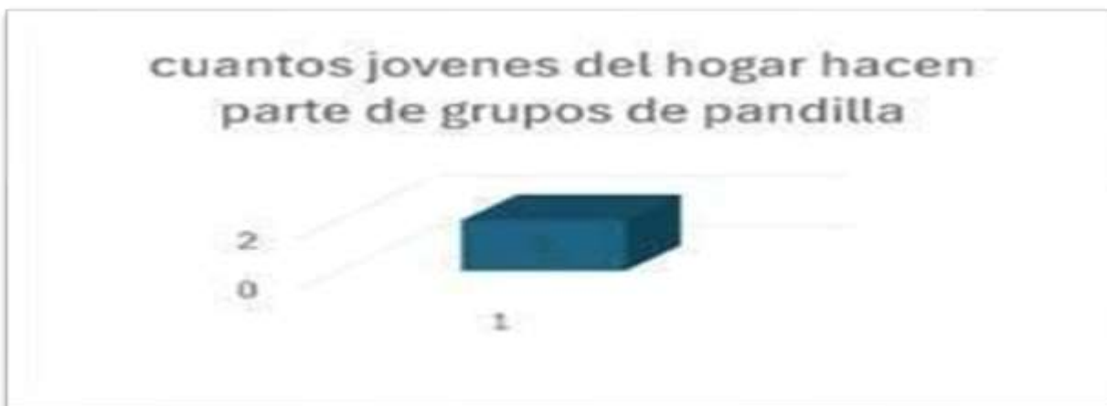
Figura 1. Muestra de jóvenes del hogar, que hacen parte de grupos de pandillas.

Nota: la figura1 muestra dos jóvenes de hogares que hacen parte de grupos de pandilla, lo que hace que muchas veces se presente problemas intrafamiliares de acciones y violencia.